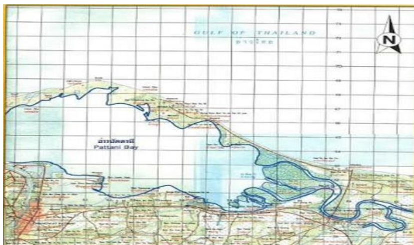
ภาพประกอบ 9 แสดงแผนที่อ่าวปัตตานี