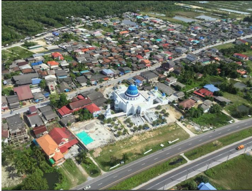
ภาพประกอบ 11 แสดงพื้นที่หมู่บ้านบางปู หมู่ที่ 3 ตำบลบางปู อำเภอยะหริ่ง