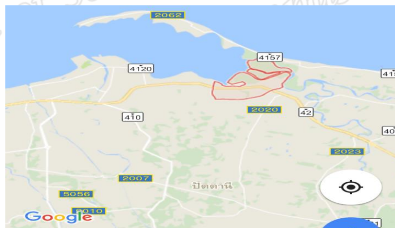
ภาพประกอบ 10 แสดงแผนที่ตำบลบางปู อำเภอยะหริ่ง จังหวัดปัตตานี