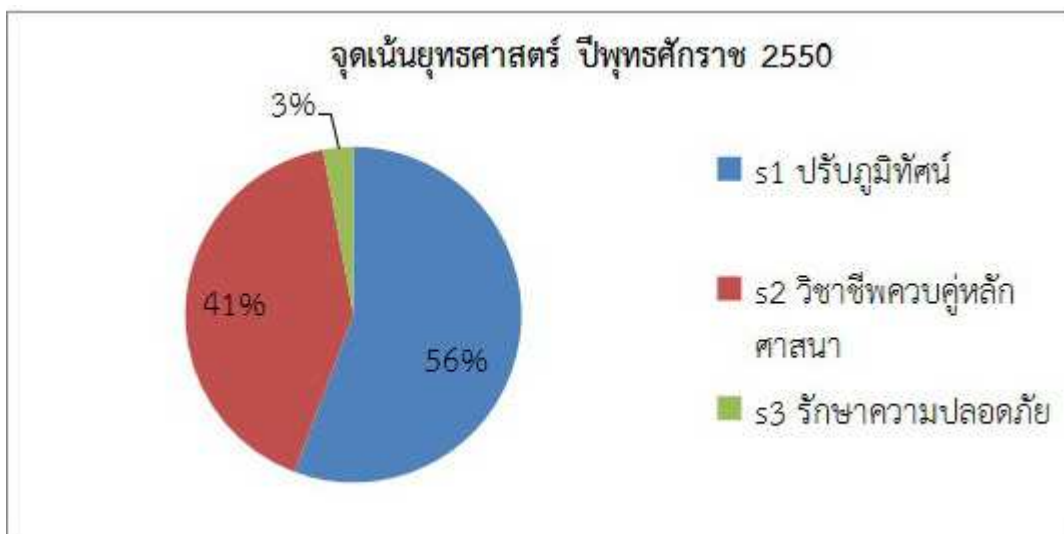
ภาพที่ 4 ยุทธศาสตร์การจัดการอาชีวศึกษาของเขตพัฒนาพิเศษเฉพาะกิจ จังหวัดชายแดนภาคใต้ พุทธศักราช 2550

จากภาพที่ 4 ยุทธศาสตร์ที่ 1 ยุทธศาสตร์การปรับปรุงภูมิทัศน์สถานศึกษาให้น่าอยู่น่าเรียน (25,455,000 บาท) ทั้ง 18 วิทยาลัยได้รับงบประมาณเพื่อไปปรับปรุงซ่อมแซมความเป็นอยู่ของสถานศึกษาให้มีความสวยงาม มีระบบเทคโนโลยีที่ทันสมัยและเกิดประสิทธิผลต่อผู้เรียนเป็นสำคัญ ได้แก่ โครงการซ่อมแซม/ปรับปรุงหอพักเดิม โครงการจัดแหล่งเรียนรู้ที่หลากหลาย โครงการพัฒนาห้องปฏิบัติการ และโครงการปรับปรุง/ซ่อมแซมอาคารสถานที่