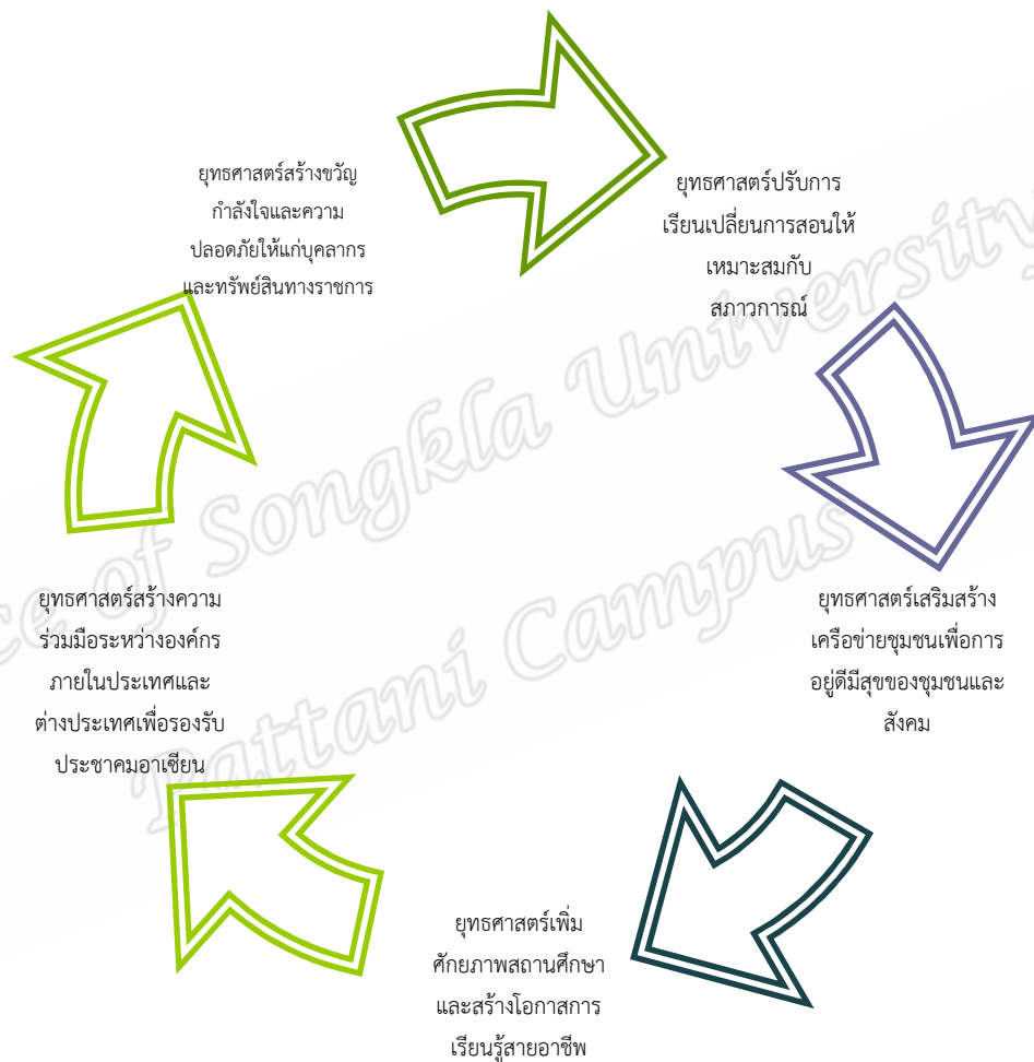
ภาพที่ 6 จุดเน้นยุทธศาสตร์การจัดการอาชีวศึกษาของเขตพัฒนาพิเศษเฉพาะกิจ จังหวัดชายแดนภาคใต้ พุทธศักราช 2551-2556

“การจัดการศึกษาเชิงรุกเพื่อมวลชน” รวมถึงการจัดอาชีวศึกษาชายแดนใต้เพื่อสร้างความมั่นคงของรัฐที่ยังคงปฏิบัติอย่างต่อเนื่อง ด้วยการส่งเสริมพัฒนาการจัดการอาชีวศึกษาและการฝึกอบรมวิชาชีพในเขตพัฒนาพิเศษเฉพาะกิจชายแดนภาคใต้ด้วยการน้อมนำยุทธศาสตร์พระราชทาน เข้าใจ เข้าถึง พัฒนา และหลักปรัชญาเศรษฐกิจพอเพียงมาใช้เป็นแนวทางในการขับเคลื่อนการปฏิบัติงานในพื้นที่สังคมจังหวัดชายแดนภาคใต้ที่มีสภาพของความเป็นพหุวัฒนธรรม โดยในปี 2551-2556 นี้มีจุดเน้นยุทธศาสตร์อยู่ 5 ประการ ดังภาพที่ 6