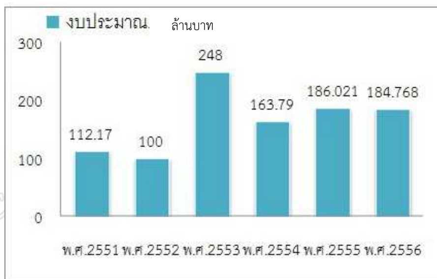
ภาพที่ 5 งบประมาณที่ได้รับการจัดสรรเพื่อการจัดการอาชีวศึกษาของเขตพัฒนาพิเศษเฉพาะกิจจังหวัดชายแดนภาคใต้ (2551-2556)

ช่วงที่ 3 ปีพุทธศักราช 2551-2556 สำนักงานคณะกรรมการการอาชีวศึกษาได้นำเสนอรายงานผลการจัดการอาชีวศึกษาของเขตพัฒนาพิเศษเฉพาะกิจจังหวัดชายแดนภาคใต้ในที่ประชุมองค์รหลักต่อคณะรัฐมนตรีกระทรวงศึกษาธิการเพื่อให้เห็นความสำเร็จของงานและความจำเป็นถึงความต้องการของมวลชนจากการทำประชาคมในพื้นที่ จึงทำให้ศูนย์พัฒนาการศึกษาอาชีวศึกษาเพื่อเขตพัฒนาพิเศษเฉพาะกิจจังหวัดชายแดนภาคใต้ (ศพต.) ได้รับความสำคัญมากยิ่งขึ้น ดังนั้น สำนักงานคณะกรรมการการอาชีวศึกษาจึงได้รับการสนับสนุนงบประมาณเพิ่มเติมจากกระทรวงศึกษาธิการเป็นการเฉพาะกิจสำหรับการจัดการอาชีวศึกษาชายแดนใต้ ตั้งแต่ปีพุทธศักราช 2551 เป็นต้นมา ดังงบประมาณที่แสดงในกราฟแผนภูมิแท่ง ภาพที่ 5