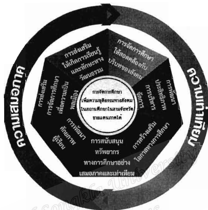
ภาพประกอบ 4 : รูปแบบการส่งเสริมการจัดการศึกษาเพื่อความยุติธรรมทางสังคมในสถานศึกษาในสามจังหวัดชายแดนภาคใต้

จากภาพประกอบ 4 รูปแบบการส่งเสริมการจัดการศึกษาเพื่อความยุติธรรมทางสังคมในสถานศึกษาในสามจังหวัดชายแดนภาคใต้เป็นรูปแบบเชิงอธิบาย (Semantic model) ที่มีโครงสร้างความคิดที่สัมพันธ์กัน ซึ่งมีหลักคิดที่สำคัญคือการมุ่งเน้นความเสมอภาคของการจัดการศึกษาบนพื้นฐานของความแตกต่าง ประกอบด้วย 7 องค์ประกอบ คือ 1) การจัดการศึกษาให้สอดคล้องกับบริบททางสังคม 2) การพัฒนาประสิทธิภาพการบริหารจัดการ 3) การสร้างเสริมโอกาสทางการศึกษา 4) การสนับสนุนทรัพยากรทางการศึกษาอย่างเสมอภาคและเท่าเทียม 5) การพัฒนาศักยภาพผู้เรียน 6) การส่งเสริมการจัดการศึกษาเพื่อความเป็นพลเมือง 7) การส่งเสริมให้เกิดการเรียนรู้และทักษะทางวัฒนธรรม