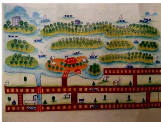
ภาพ 4.1 แผนที่เดินดินชุมชนท่องเที่ยวบางปู