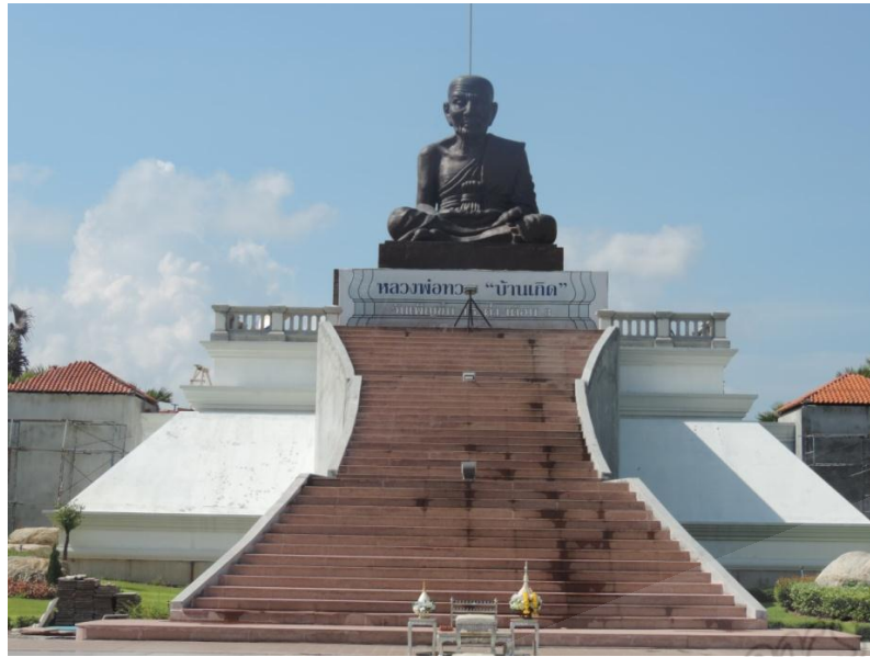
ภาพประกอบที่ ๓๑ รูปหล่อหลวงพ่อกวด ภายในสวนประวัติศาสตร์ พลเอกเปรม- ติณสูลานนท์ สงขลา