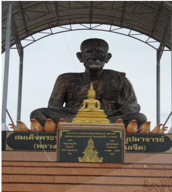
ภาพประกอบที่ ๒๙ รูปหล่อหลวงพ่อทวดองค์ใหญ่วัดดีหลวง หมู่ที่ ๒ ตำบลดีหลวง อำเภอสทิงพระ จังหวัดสงขลา