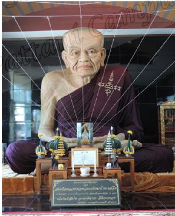
ภาพประกอบที่ ๓๐ หลวงพ่อทวดองค์ใหญ่ภายในวิหาร สำนักสงฆ์ต้นเลียบ หมู่ที่ ๑ ตำบลดีหลวงอำเภอสทิงพระ จังหวัดสงขลา