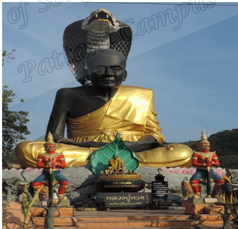
ภาพประกอบที่ ๓๒ รูปปั้นหลวงพ่อกวด ศาลเจ้าเทพนาจาหาดใหญ่ ตำบลคอหงส์ อำเภอหาดใหญ่ จังหวัดสงขลา