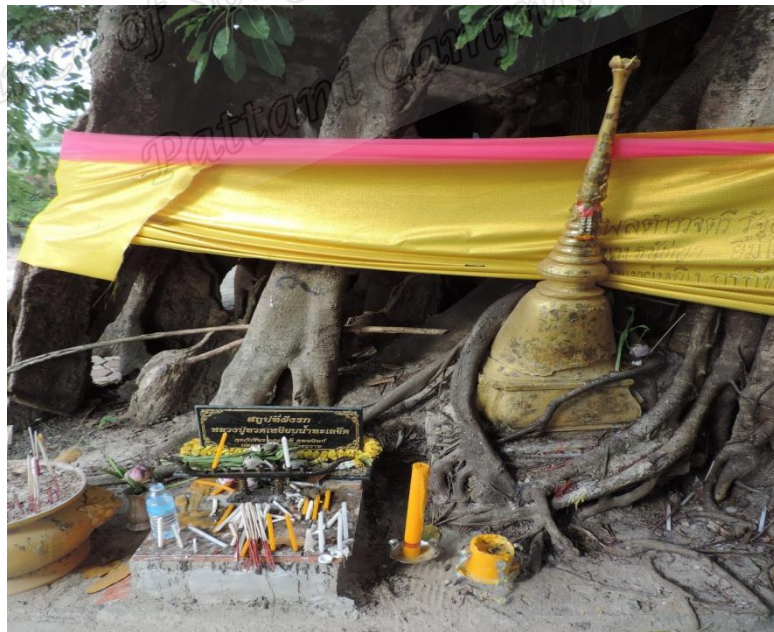
ภาพประกอบที่ ๒ สลุปที่ฝังรกรสมเด็จพระเจ้าพะโคะ สำนักสงฆ์ต้นเลียบ หมู่ที่ ๑ ตำบลดีหลวง อำเภอสทิงพระ จังหวัดสงขลา