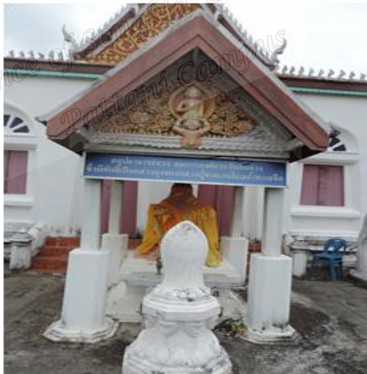
ภาพประกอบที่ ๑๕ สตูปเก็บอัฐิสมภารจวง อดีตเจ้าอาวาสวัดดีหลวง หมู่ที่ ๒ ตำบลดีหลวง อำเภอสทิงพระ จังหวัดสงขลา