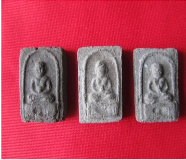
ภาพประกอบที่ ๑๖ พระเครื่องสมเด็จพระเจ้าพะโคะ รุ่นแรก พ.ศ.๒๕๐๔ ของวัดดีหลวง หมู่ที่ ๒ ตำบลดีหลวง อำเภอสังขละบุรี จังหวัดสงขลา