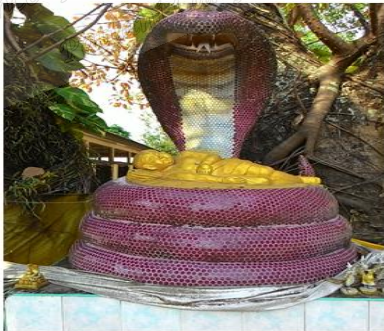
ภาพประกอบที่ ๙ รูปปั้นพญางูคายแก้ว สำนักสงฆ์ต้นเลียบ หมู่ที่ ๑ ตำบลตีหลวง อำเภอสทิงพระ จังหวัดสงขลา