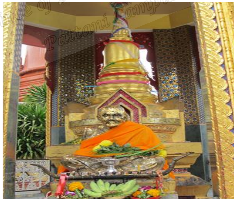
ภาพประกอบที่ ๑๙ สถูปเก็บอัฐิของหลวงพ่อทวดเหยียบน้ำทะเลจืด วัดราชบุรณะ (วัดช้างให้) หมู่ที่ ๒ ตำบลควนโนรี อำเภอกะปง จังหวัดปัตตานี