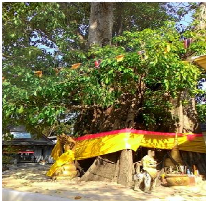
ภาพประกอบที่ ๑๓ ต้นเลียบสถานที่ฝังรกรงสมเด็จพระเจ้าพะโคะหรือหลวงพ่อทวด หมู่ที่ ๑ ตำบลดีหลวง อำเภอสทิงพระ จังหวัดสงขลา