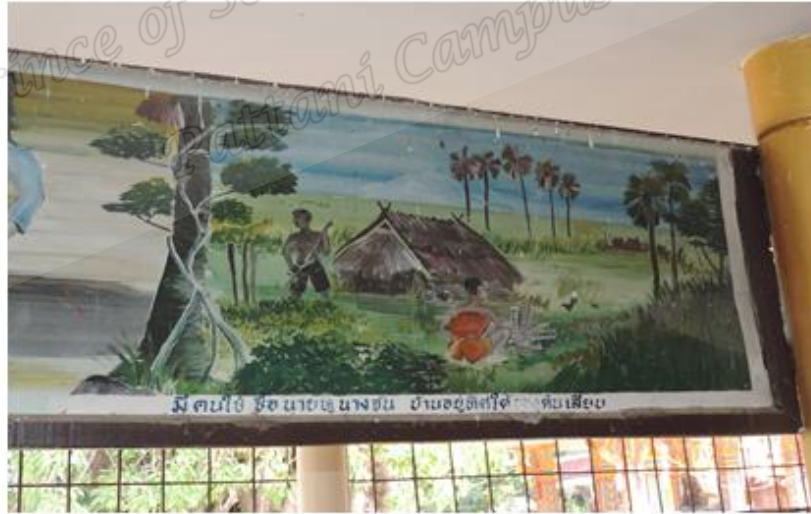
ภาพประกอบที่ ๑๑ จิตรกรรมฝาผนังตำนานหลวงพ่อทวด ตอน นายหูกับนางจัน อาศัยอยู่ ที่บ้านสวนจันทร์ทางทิศใต้ของต้นเลียบเขียนไว้ภายในวิหารสำนักสงฆ์ ต้นเลียบ หมู่ที่ ๑ ตำบลดีหลวง อำเภอสังขละ จังหวัดสงขลา