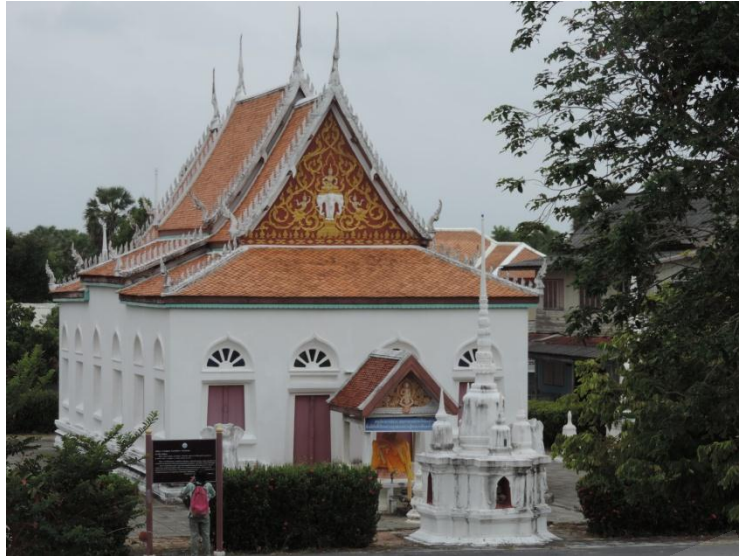
ภาพประกอบที่ ๑๔ อุโบสถวัดดีหลวง หมู่ที่ ๒ ตำบลดีหลวง อำเภอสทิงพระ จังหวัดสงขลา สถานที่บรรพชาของสมเด็จพระเจ้าพะโคะ