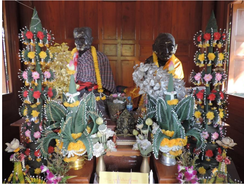
ภาพประกอบที่ ๘ รูปปั้นนายหูกับนางจันทร์ บิดาและมารดาของสมเด็จพระเจ้าพะโคะ ภายในสำนักสงฆ์ต้นเลียบ หมู่ที่ ๑ ตำบลตีหลวง อำเภอสทิงพระ จังหวัดสงขลา