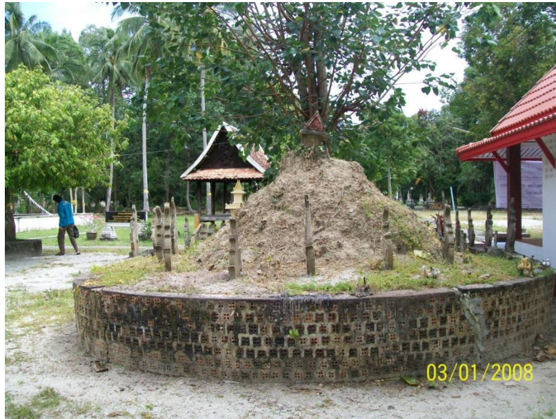
ภาพประกอบที่ ๒๒ สถานที่ปักกลดสมเด็จพระเจ้าพะโคะวัดพุทธสีมา หมู่ที่ ๗ ตำบลท่าซอม อำเภอดำเนินสะดวก จังหวัดนครศรีธรรมราช