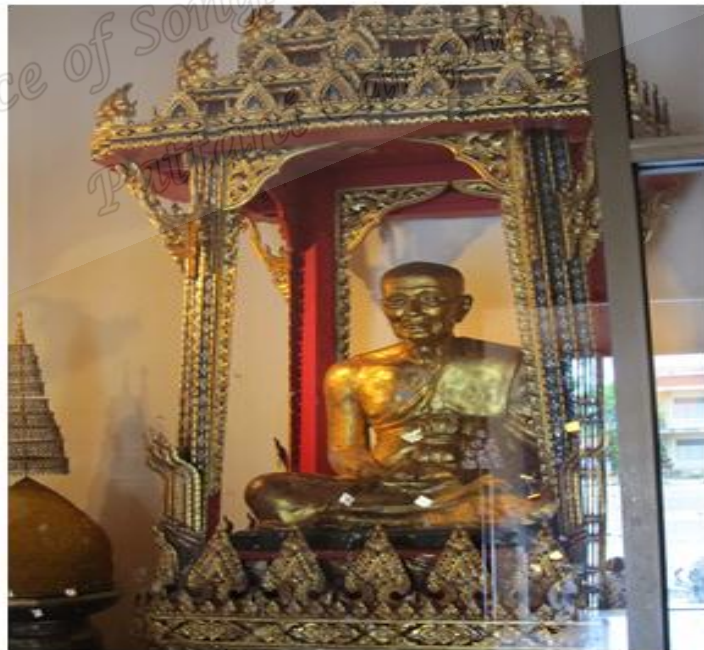
ภาพประกอบที่ ๒๑ รูปหล่อหลวงพ่อทวดเหยียบน้ำทะเลจืด ภายในวิหารวัดราษฎร์บูรณะ (วัดช้างไห้) หมู่ที่ ๒ ตำบลควนโนรี อำเภอโคกโพธิ์ จังหวัดปัตตานี