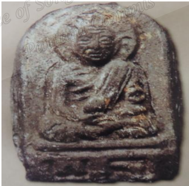
ภาพประกอบที่ ๑๗ พระเครื่องสมเด็จพระเจ้าพะโคะ รุ่นแรก พ.ศ.๒๕๐๖ ของวัดพะโคะ หมู่ที่ ๖ ตำบลชุมพล อำเภอสังขละบุรี จังหวัดสงขลา