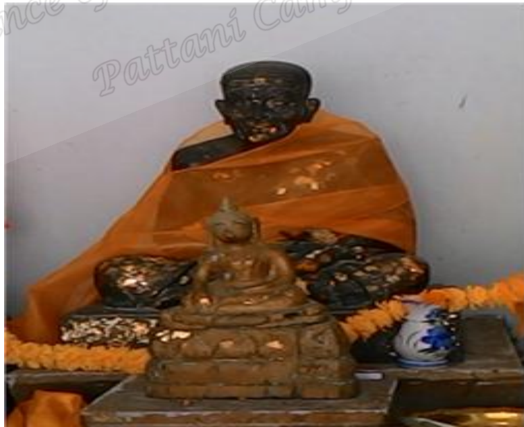
ภาพประกอบที่ ๒๕ รูปหล่อหลวงพ่อดวงภายในวิหารวัดหัวลำภู หมู่ที่ ๔ ตำบลหัวไทร อำเภอกหัวไทร จังหวัดนครศรีธรรมราช