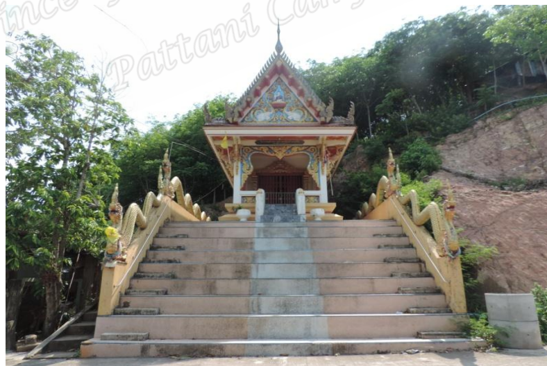
ภาพประกอบที่ ๒๓ วิหารหลวงพ่อทวด สถานที่ปักกลดของสมเด็จพระเจ้าพะโคะ บ้านบ่อสวน หมู่ที่ ๘ ตำบลหัวเขา อำเภอสี่นคร จังหวัดสงขลา