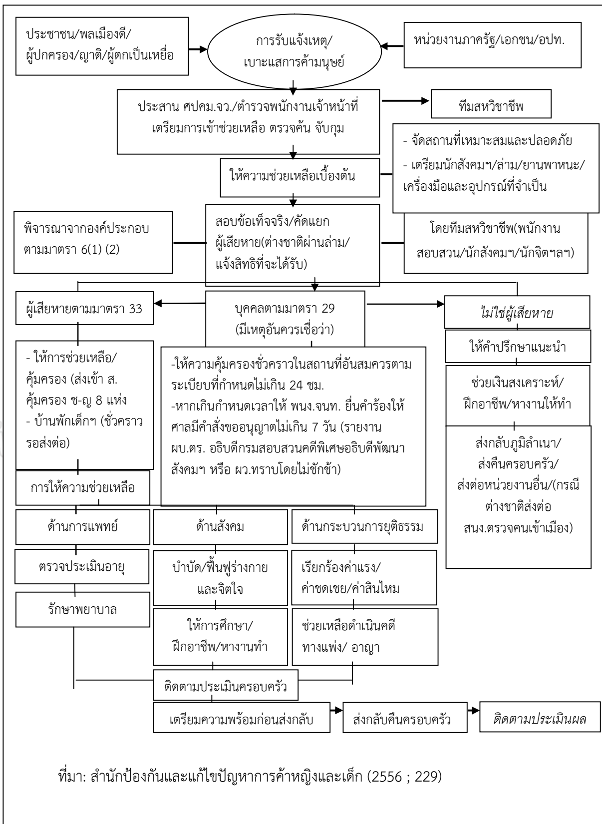
ภาพที่ 1 ขั้นตอนการทำงานของทีมสหวิชาชีพในการคุ้มครองช่วยเหลือผู้เสียหายจากการค้ามนุษย์