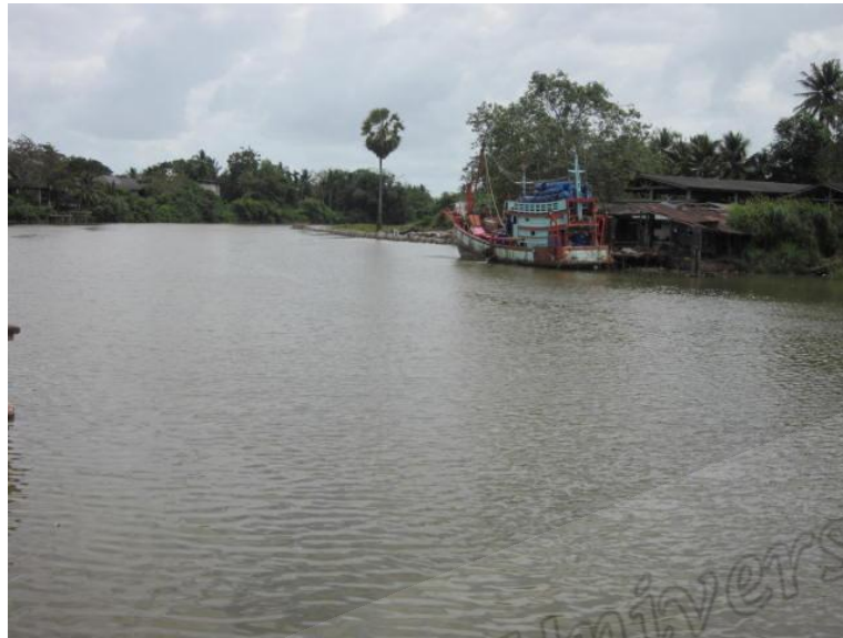
ภาพประกอบที่ ๒๗ คลองท่าแพไหลผ่านวัดท่าแพ สถานที่อุปสมบทของหลวงพ่อทวด ตำบลปากพูน อำเภอเมือง จังหวัดนครศรีธรรมราช