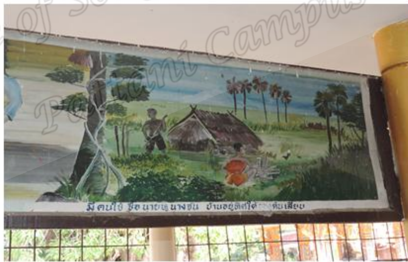
ภาพประกอบที่ ๑๑ จิตรกรรมฝาผนังตำนานหลวงพ่อทวด ตอน นายหูกับนางจัน อาศัยอยู่ ที่บ้านสวนจันทร์ทางทิศใต้ของต้นเลียบเขียนไว้ภายในวิหารสำนักสงฆ์ ต้นเลียบ หมู่ที่ ๑ ตำบลดีหลวง อำเภอสังขละ จังหวัดสงขลา