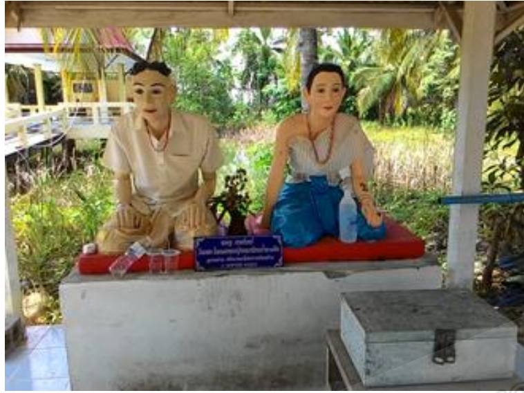
ภาพประกอบที่ ๓ รูปปั้นนายหูกับนางจันทร์ บิดาและมารดาของสมเด็จพระเจ้าพะโคะ ภายในที่พักรักษาเนเปล หมู่ที่ ๖ ตำบลชุมพล อำเภอสังขละ จังหวัดสงขลา