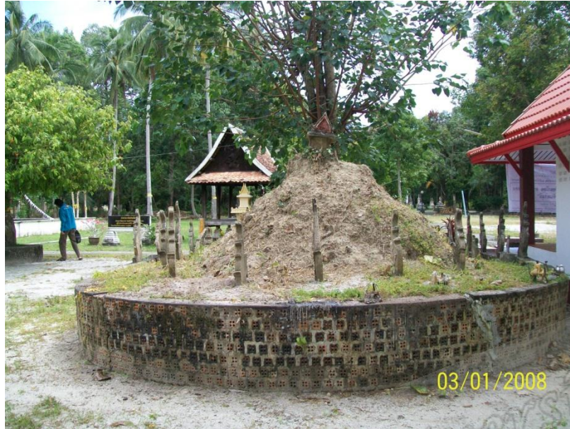
ภาพประกอบที่ ๒๒ สถานที่ปักกลดสมเด็จพระเจ้าพะโคะวัดพุทธสีมา หมู่ที่ ๗ ตำบลท่าซอม อำเภอดงหลวง จังหวัดนครศรีธรรมราช