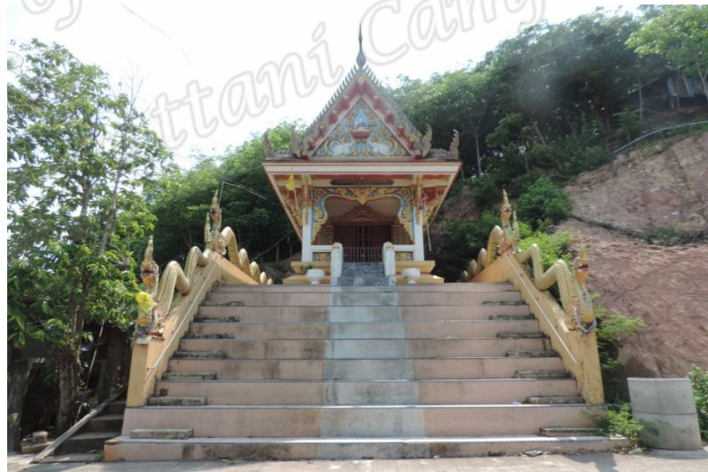
ภาพประกอบที่ ๒๓ วิหารหลวงพ่อทวด สถานที่ปักกลดของสมเด็จพระเจ้าพะโคะ บ้านบ่อสวน หมู่ที่ ๘ ตำบลหัวเขา อำเภอสี่นคร จังหวัดสงขลา