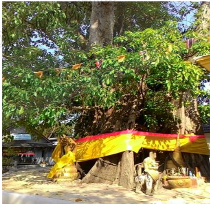
ภาพประกอบที่ ๑๓ ต้นเลียบสถานที่ฝังรกรงสมเด็จพระเจ้าพะโคะหรือหลวงพ่อทวด หมู่ที่ ๑ ตำบลดีหลวง อำเภอสทิงพระ จังหวัดสงขลา