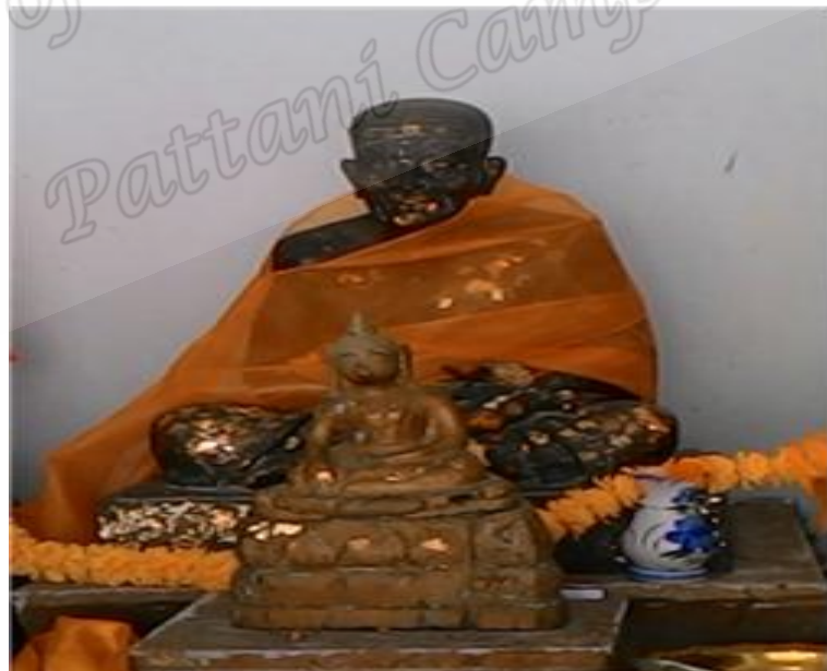
ภาพประกอบที่ ๒๕ รูปหล่อหลวงพ่อดวงภายในวิหารวัดหัวลำภู หมู่ที่ ๔ ตำบลหัวไทร อำเภอกหัวไทร จังหวัดนครศรีธรรมราช