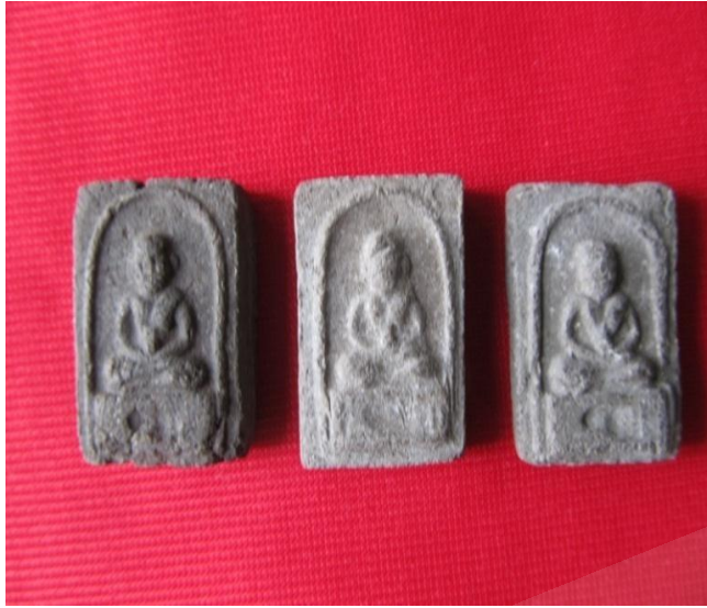
ภาพประกอบที่ ๑๖ พระเครื่องสมเด็จพระเจ้าพะโคะ รุ่นแรก พ.ศ.๒๕๐๔ ของวัดดีหลวง หมู่ที่ ๒ ตำบลดีหลวง อำเภอสังขละบุรี จังหวัดสงขลา