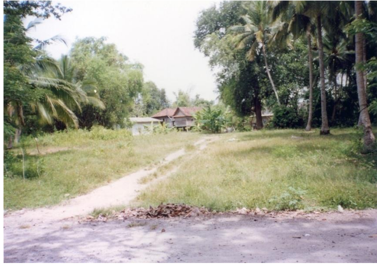
ภาพประกอบที่ ๑ บ้านสวนจันทร์ เป็นสถานที่เกิดของสมเด็จพระเจ้าพะโคะ หมู่ที่ ๒ ตำบลดีหลวง อำเภอสทิงพระ จังหวัดสงขลา