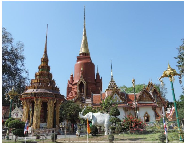
ภาพประกอบที่ ๑๘ เจดีย์พระมหาธาตุวัดราชบุรณะ (วัดช้างให้) หมู่ที่ ๒ ตำบลควนโนรี อำเภอกะป้อ จังหวัดปัตตานี