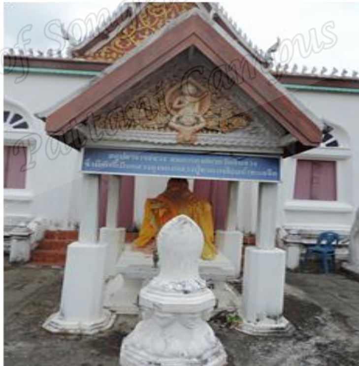
ภาพประกอบที่ ๑๕ สตูปเก็บอัฐิสมภารจวง อดีตเจ้าอาวาสวัดดีหลวง หมู่ที่ ๒ ตำบลดีหลวง อำเภอสิงหนคร จังหวัดสงขลา