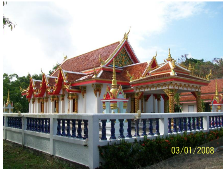
ภาพประกอบที่ ๒๔ วัดหัวลำภู สถานที่ปักกลดของสมเด็จพระเจ้าพะโคะ หมู่ที่ ๔ ตำบลหัวไทร อำเภอกหัวไทร จังหวัดนครศรีธรรมราช