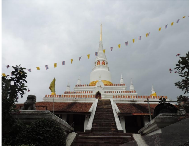
ภาพประกอบที่ ๕ พระศรีรัตนมหาธาตุ วัดราชประดิษฐารามหรือวัดพะโคะ หมู่ที่ ๖ ตำบลชุมพล อำเภอสิงหนคร จังหวัดสงขลา

Prince of Songkhro University Pattani Campus