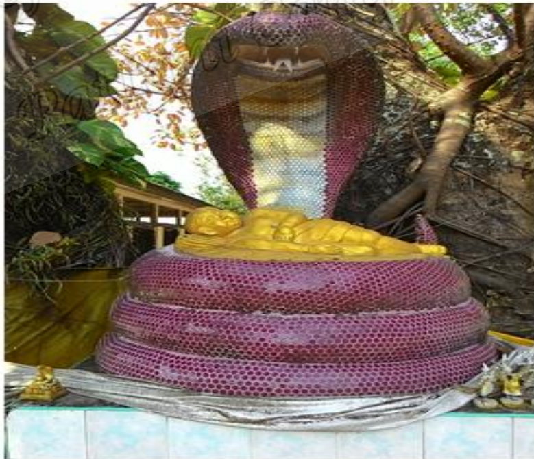
ภาพประกอบที่ ๙ รูปปั้นพญางูคายแก้ว สำนักสงฆ์ต้นเลียบ หมู่ที่ ๑ ตำบลตีหลวง อำเภอสังขละ จังหวัดสงขลา