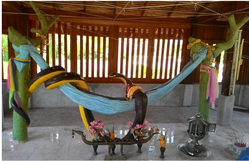
ภาพประกอบที่ ๑๐ รูปจำลองพญางูคายดวงแก้วให้สมเด็จพระเจ้าพะโคะ เมื่อยังเป็นทารก ที่พัทสงฆ์นาเปล หมู่ที่ ๖ ตำบลชุมพล อำเภอสังขละ จังหวัดสงขลา