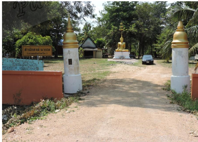
ภาพประกอบที่ ๔ ที่พักรักษาเนเปล หมู่ที่ ๖ ตำบลชุมพล อำเภอสังขละ จังหวัดสงขลา