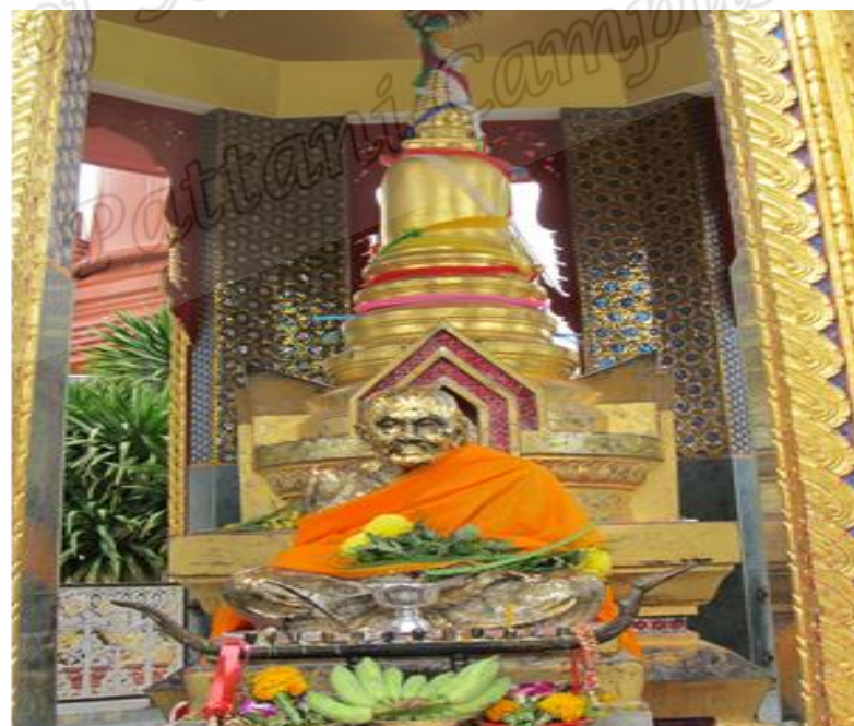
ภาพประกอบที่ ๑๙ สถูปเก็บอัฐิของหลวงพ่อทวดเหยียบน้ำทะเลจืด วัดราชบุรณะ (วัดช้างให้) หมู่ที่ ๒ ตำบลควนโนรี อำเภอกะป้อ จังหวัดปัตตานี