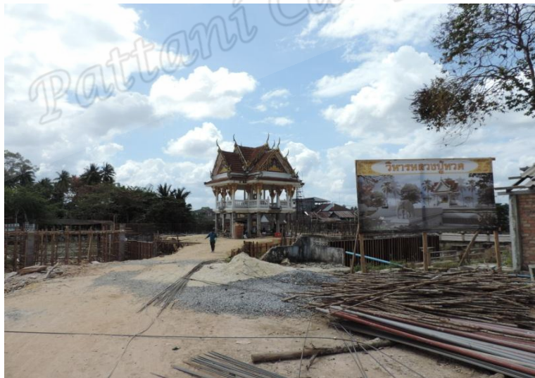
ภาพประกอบที่ ๒๘ วิหารหลวงพ่อดำริมคลองท่าแพ วัดท่าแพ ตำบลปากพูน อำเภอเมือง จังหวัดนครศรีธรรมราช