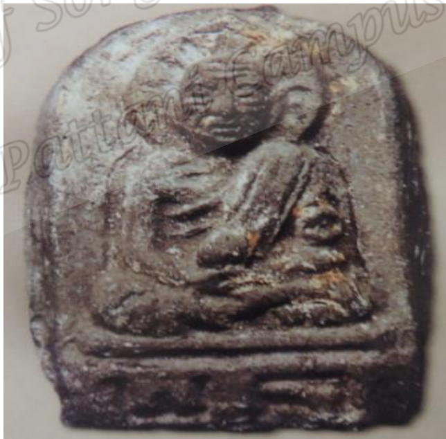
ภาพประกอบที่ ๑๗ พระเครื่องสมเด็จพระเจ้าพะโคะ รุ่นแรก พ.ศ.๒๕๐๖ ของวัดพะโคะ หมู่ที่ ๖ ตำบลชุมพล อำเภอสังขละบุรี จังหวัดสงขลา