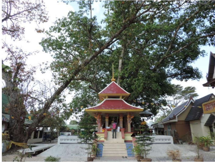
ภาพประกอบที่ ๑๒ วิหารหลวงพ่อทวดที่หน้าต้นเลียบ สำนักสงฆ์ต้นเลียบ หมู่ที่ ๑ ตำบลดีหลวง อำเภอสทิงพระ จังหวัดสงขลา