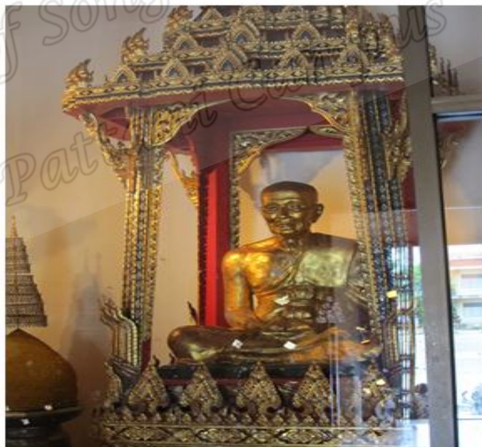
ภาพประกอบที่ ๒๑ รูปหล่อหลวงพ่อทวดเหยียบน้ำทะเลจืด ภายในวิหารวัดราชภูรณะ (วัดช้างไห้) หมู่ที่ ๒ ตำบลควนโนรี อำเภอโคกโพธิ์ จังหวัดปัตตานี