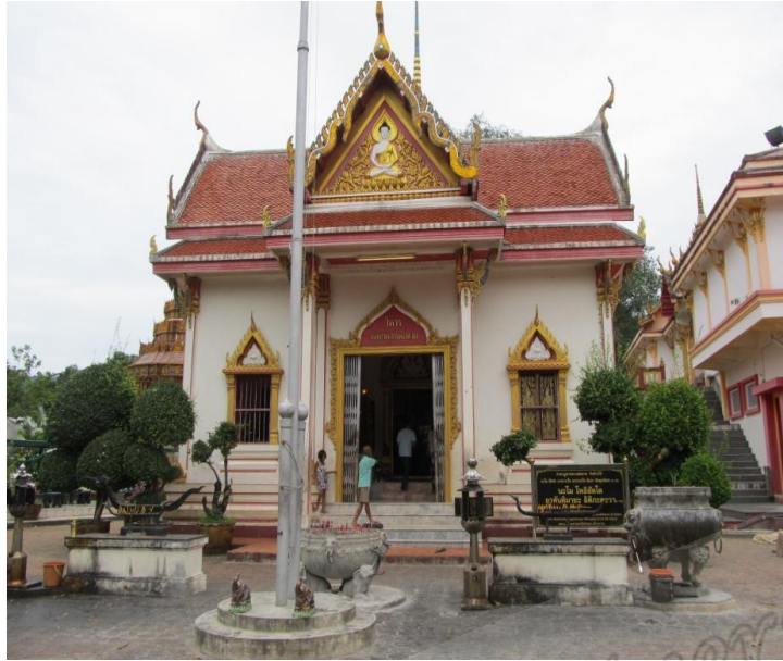
ภาพประกอบที่ ๒๐ วิหารหลวงพ่อทวดเหยียบน้ำทะเลจืด ภายในวัดราชภูรณะ (วัดช้างไห้) หมู่ที่ ๒ อำเภอโคกโพธิ์ จังหวัดปัตตานี