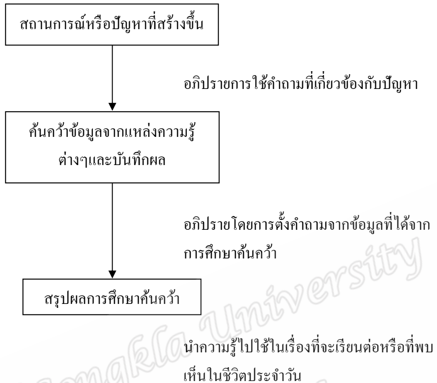
ภาพประกอบ 2 แสดงกิจกรรมขั้นตอนการจัดการเรียนรู้แบบสืบเสาะหาความรู้ (พันธ์ ทองชุมนุม 2547, 54)

สาขาชีววิทยา สสวท. (2546, 219-220; ชูศิลป์ อัดชู 2550, 56-57) ได้กล่าวถึงขั้นตอนการจัดการเรียนรู้แบบสืบเสาะหาความรู้ ซึ่งมีความสอดคล้องกับการจัดการเรียนรู้แบบวัฏจักรการเรียนรู้ (learning cycle) ที่นำเสนอโดยนักการศึกษากลุ่ม BSCS (Biological Science Curriculum Study) ประกอบด้วยขั้นตอนสำคัญ 5 ขั้นตอน ดังนี้