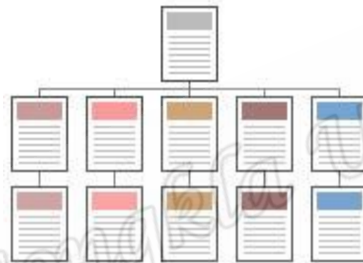
ภาพประกอบ 3 โครงสร้างแบบลำดับชั้น (Hierarchical Structure)

เป็นวิธีที่ดีที่สุดวิธีหนึ่งในการจัดระบบโครงสร้างที่มีความซับซ้อนของข้อมูล โดยแบ่งเนื้อหาออกเป็นส่วนต่างๆ และมีรายละเอียดย่อยๆ ในแต่ละส่วนลดหลั่นกันมาในลักษณะแนวคิดเดียวกับแผนภูมิองค์กร เนื่องจากผู้ใช้ส่วนใหญ่จะคุ้นเคยกับลักษณะของแผนภูมิแบบองค์กรทั่วๆ ไปอยู่แล้ว จึงเป็นการง่ายต่อการทำความเข้าใจกับโครงสร้างของเนื้อหาในเว็บลักษณะนี้ ลักษณะเด่นเฉพาะของเว็บประเภทนี้คือการมีจุดเริ่มต้นที่จุดรวมจุดเดียว นั่นคือ โฮมเพจ (Homepage) และเชื่อมโยงไปสู่เนื้อหาในลักษณะเป็นลำดับจากบนลงล่าง