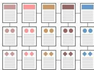
ภาพประกอบ 4 โครงสร้างแบบตาราง (Grid Structure)