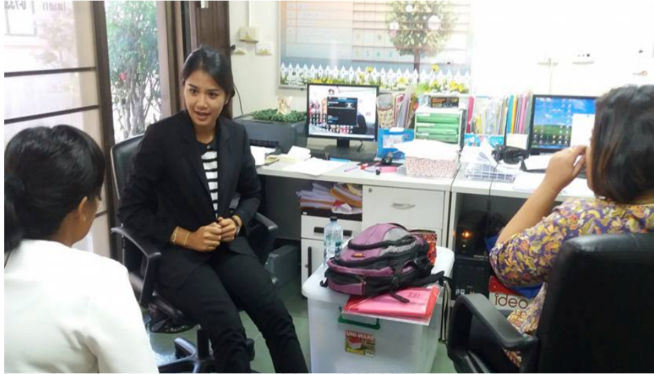
การสนทนากลุ่ม (Group Discussion)

การสัมภาษณ์เชิงลึกเจ้าหน้าที่ผู้ปฏิบัติงานช่วยเหลือ เด็กและหญิงที่ตกเป็นผู้เสียหายจากการค้ามนุษย์