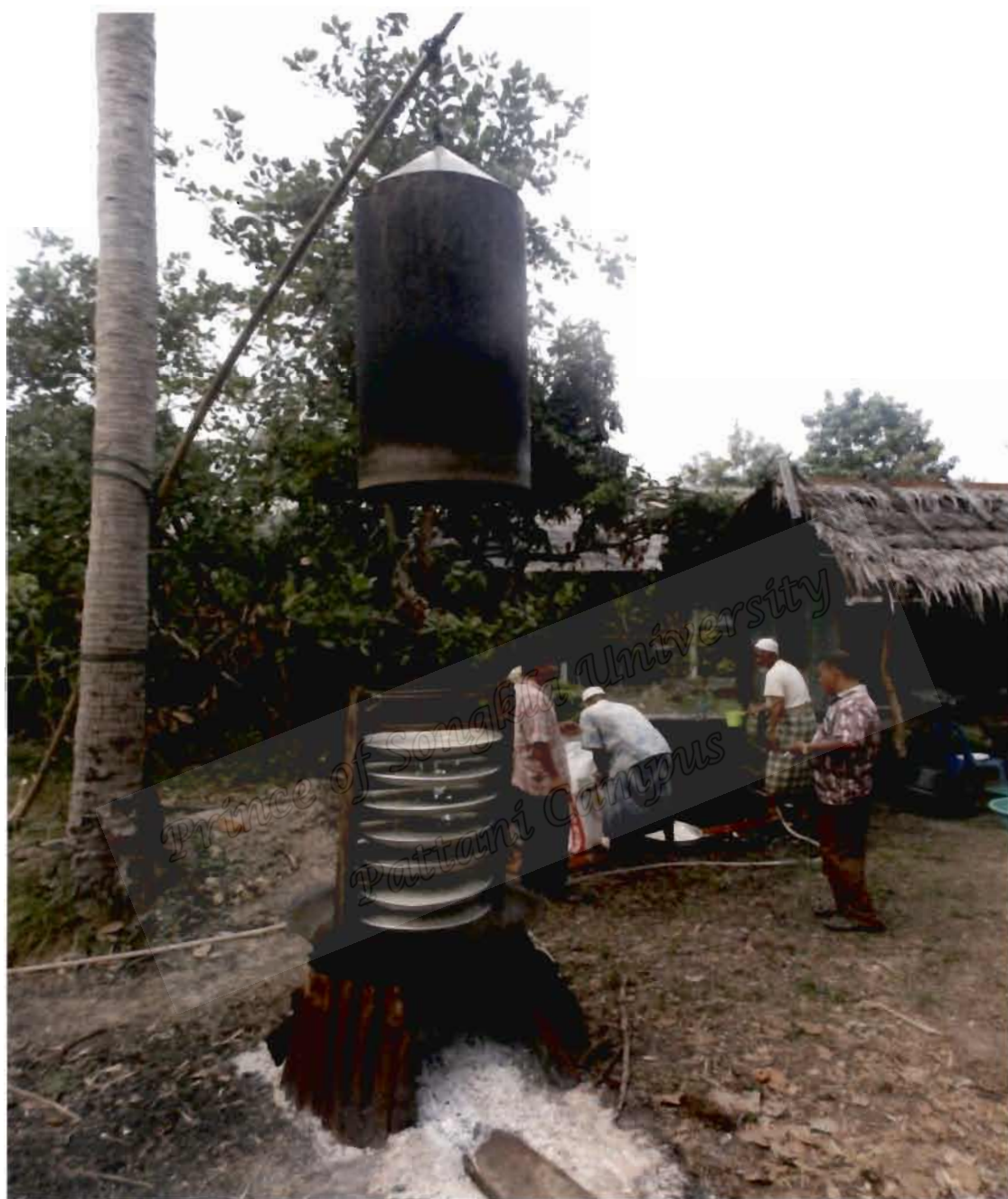
ภาพประกอบที่ 2 การช่วยเหลือในงานเลี้ยงสมรส