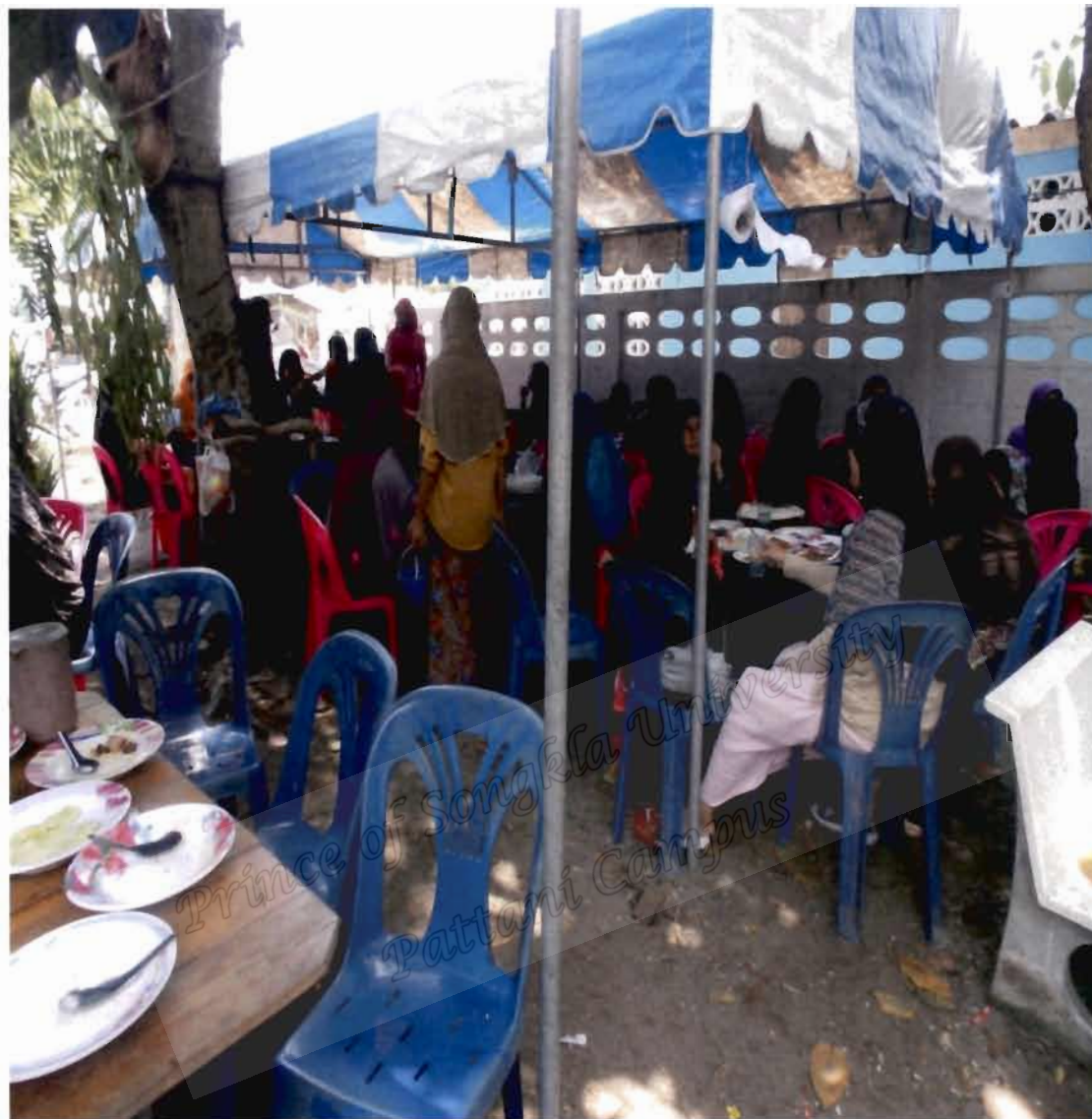
ภาพประกอบที่ 4 บรรยากาศสถานที่จัดงานเลี้ยงสมรสฝ่ายหญิง