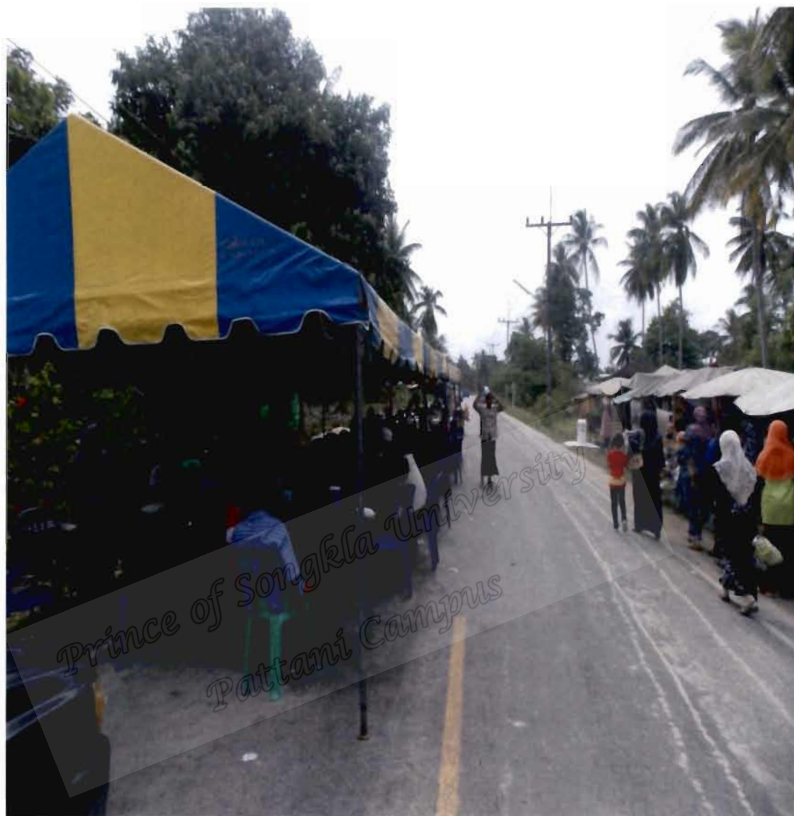
ภาพประกอบที่ 3 บรรยากาศสถานที่จัดงานเลี้ยงสมรสฝ่ายผู้ชาย