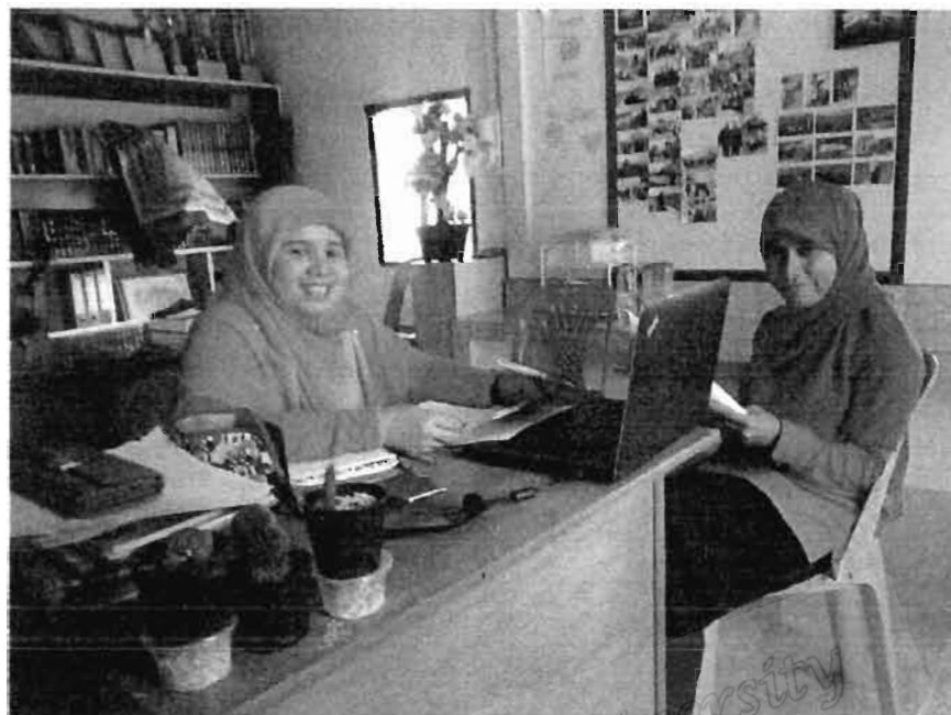
ครูสอนศาสนาโรงเรียนประทีปวิทยา