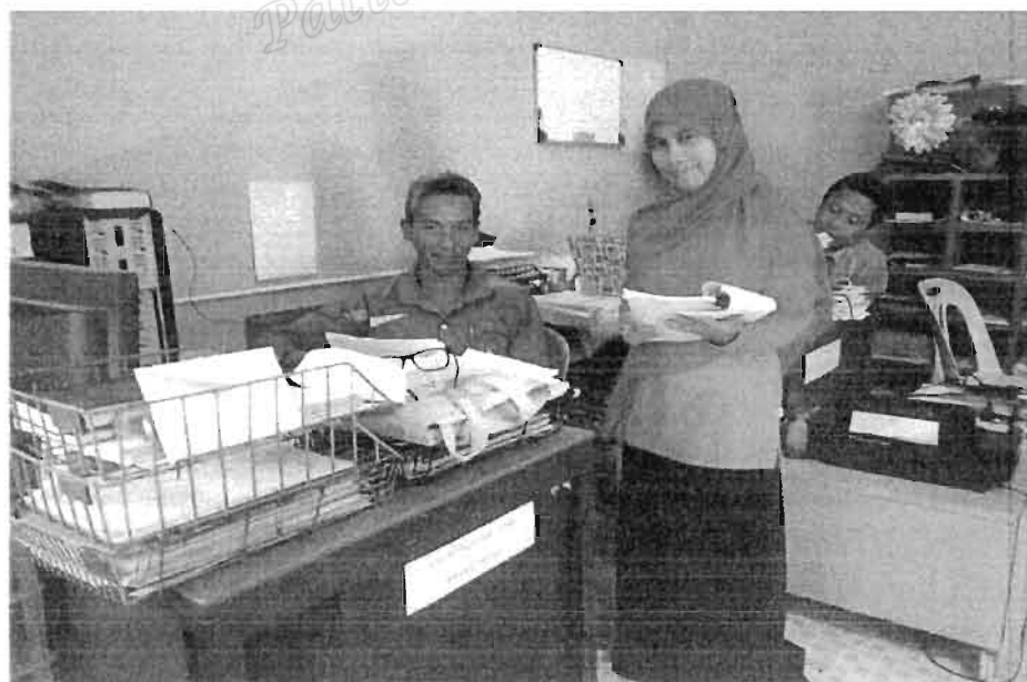
ครูสอนสามัญ โรงเรียนประทีปวิทยา