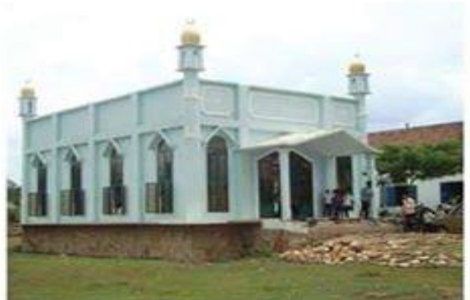
ملحق رقم (24): صورة مسجد صلاح الدين