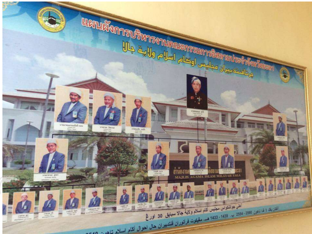
ภาพที่ 4 แผนผังการบริหารงานคณะกรรมการอิสลามประจำจังหวัดยะลา ถ่ายเมื่อวันที่ 29 มีนาคม 2560 ที่สำนักงานคณะกรรมการอิสลามประจำจังหวัดยะลา