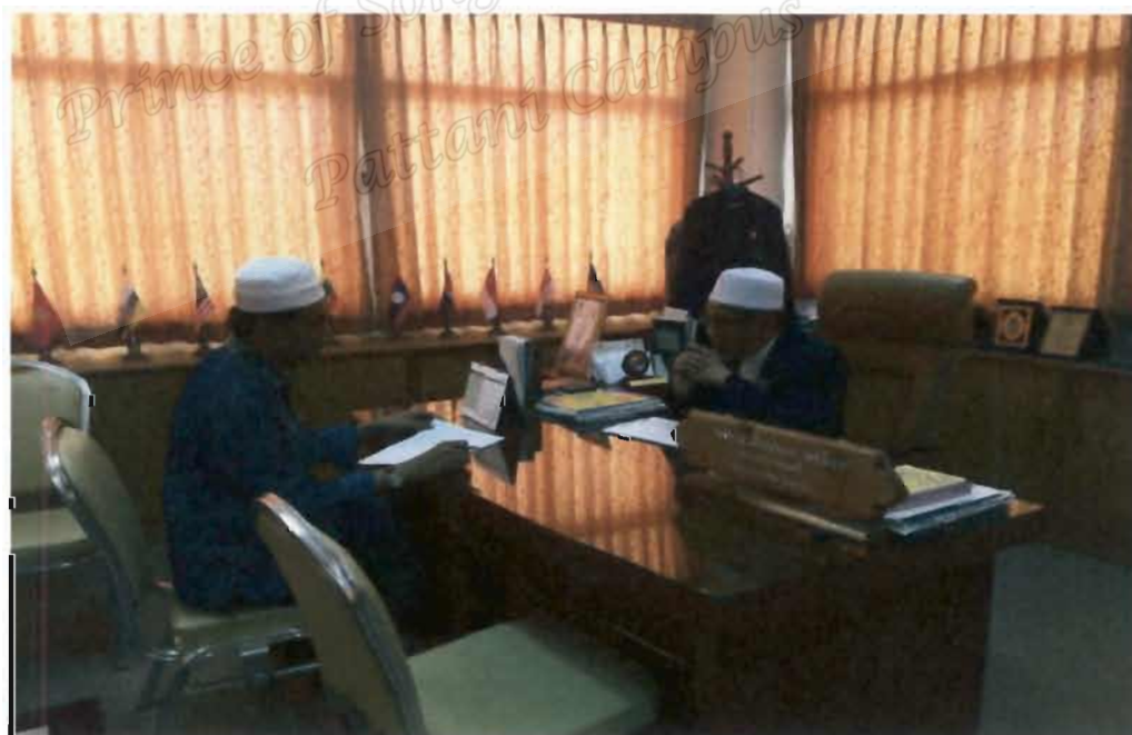
ภาพที่ 2 ประธานคณะกรรมการอิสลามประจำจังหวัดปัตตานี