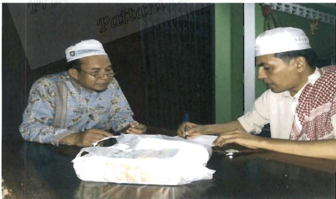
ภาพที่ 14 รองประธานคณะกรรมการอิสลามประจำจังหวัดยะลา