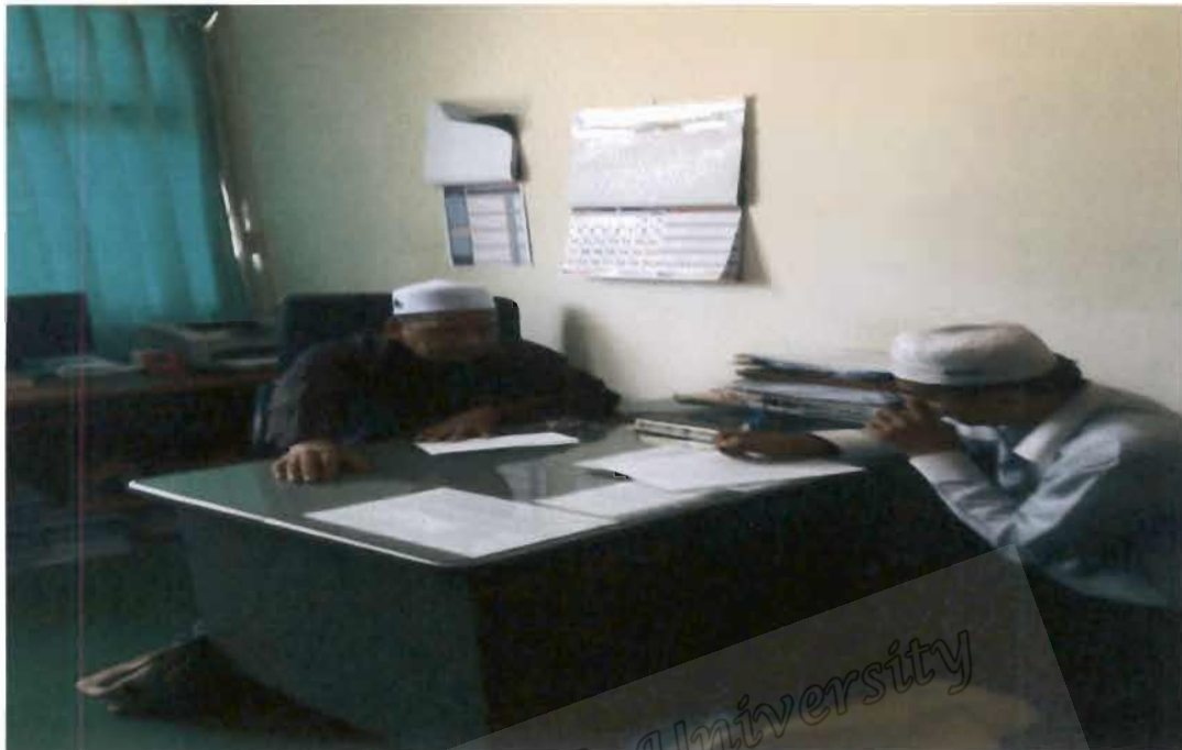
ภาพที่ 15 กรรมการกลางอิสลามแห่งประเทศไทย ผู้แทนจังหวัดนราธิวาส