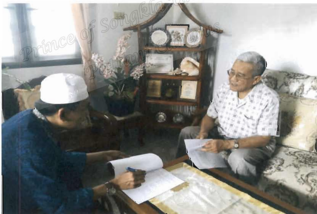
ภาพที่ 10 กรรมการกลางอิสลามแห่งประเทศไทย ผู้แทนจังหวัดปัตตานี