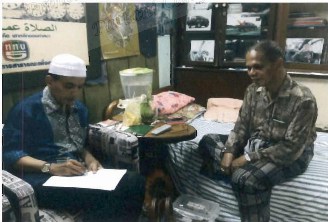
ภาพที่ 22 กรรมการกลางอิสลามแห่งประเทศไทย ผู้แทนจังหวัดยะลา