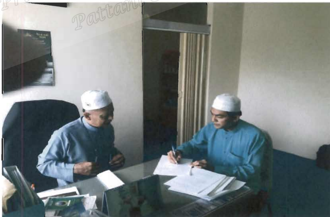
ภาพที่ 8 รองประธานคณะกรรมการอิสลามประจำจังหวัดยะลา