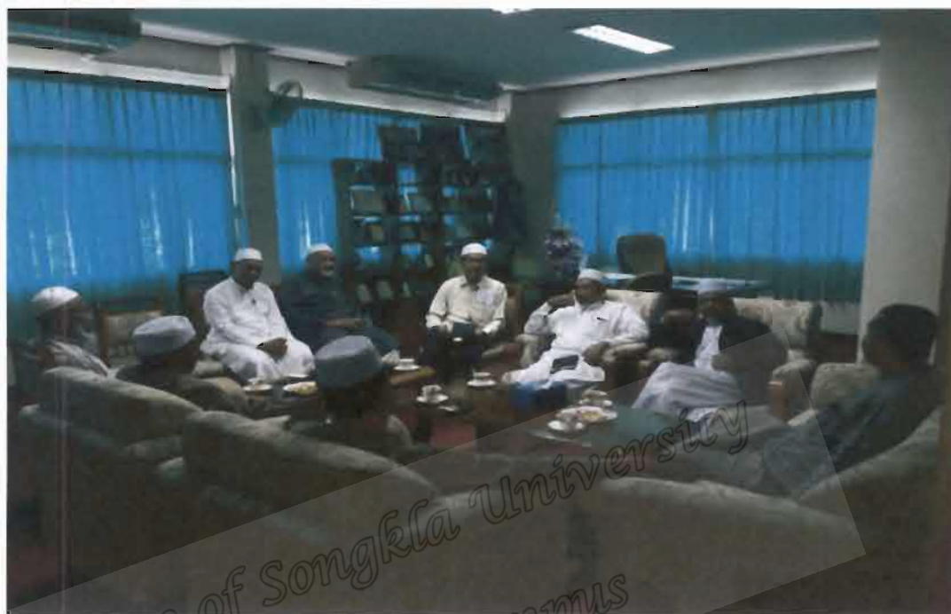
ภาพที่ 23 สำนักงานคณะกรรมการอิสลามประจำจังหวัดนราธิวาส

Focus Groups เพื่อสรุปกลยุทธ์การบริหารงานเครือข่ายของสำนักงานคณะกรรมการอิสลามประจำ จังหวัดในสามจังหวัดชายแดนภาคใต้ในทศวรรษหน้า (2561-2570)