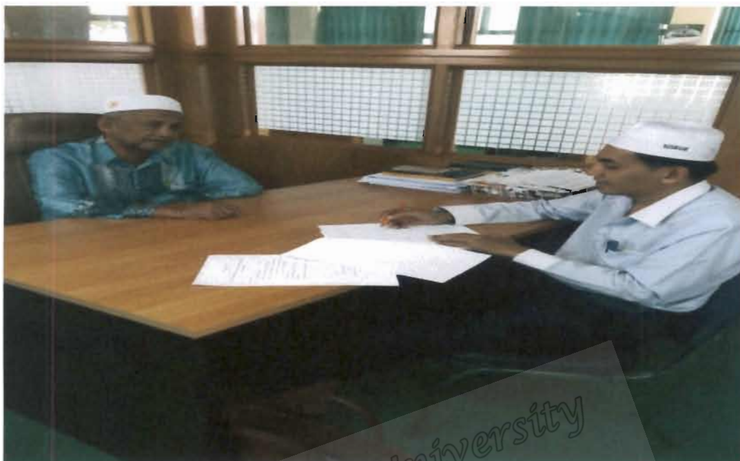
ภาพที่ 17 รองประธานคณะกรรมการอิสลามประจำจังหวัดนราธิวาส