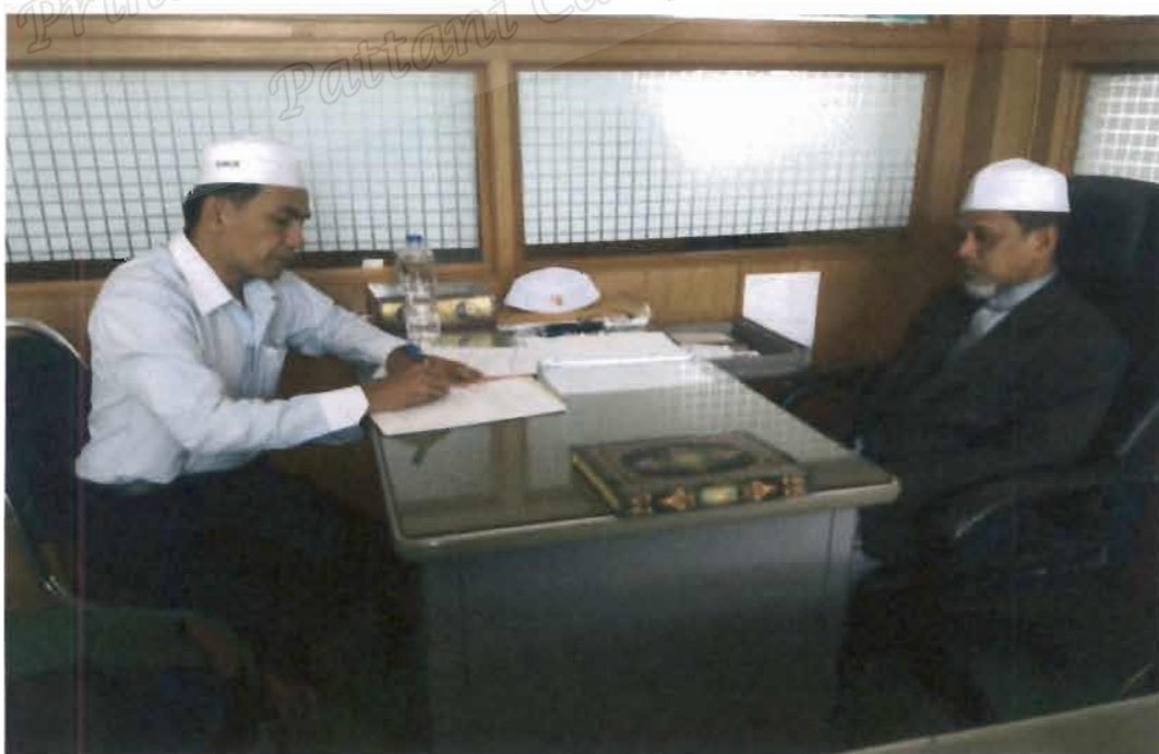
ภาพที่ 18 รองประธานคณะกรรมการอิสลามประจำจังหวัดนราธิวาส