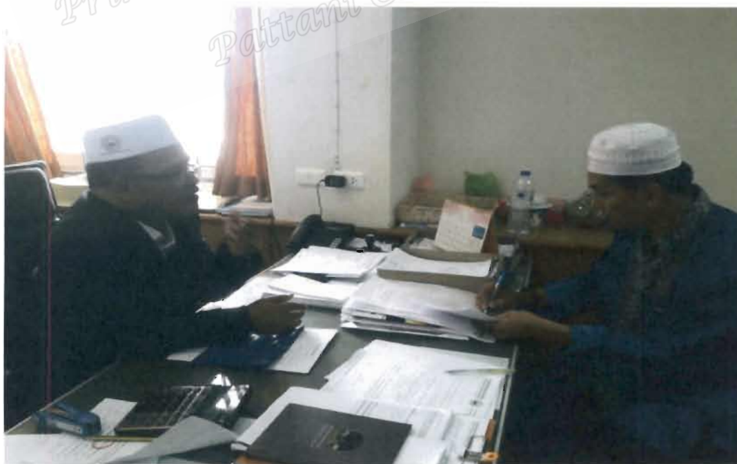
ภาพที่ 12 ประธานชมรมอิหม่ามจังหวัดปัตตานี