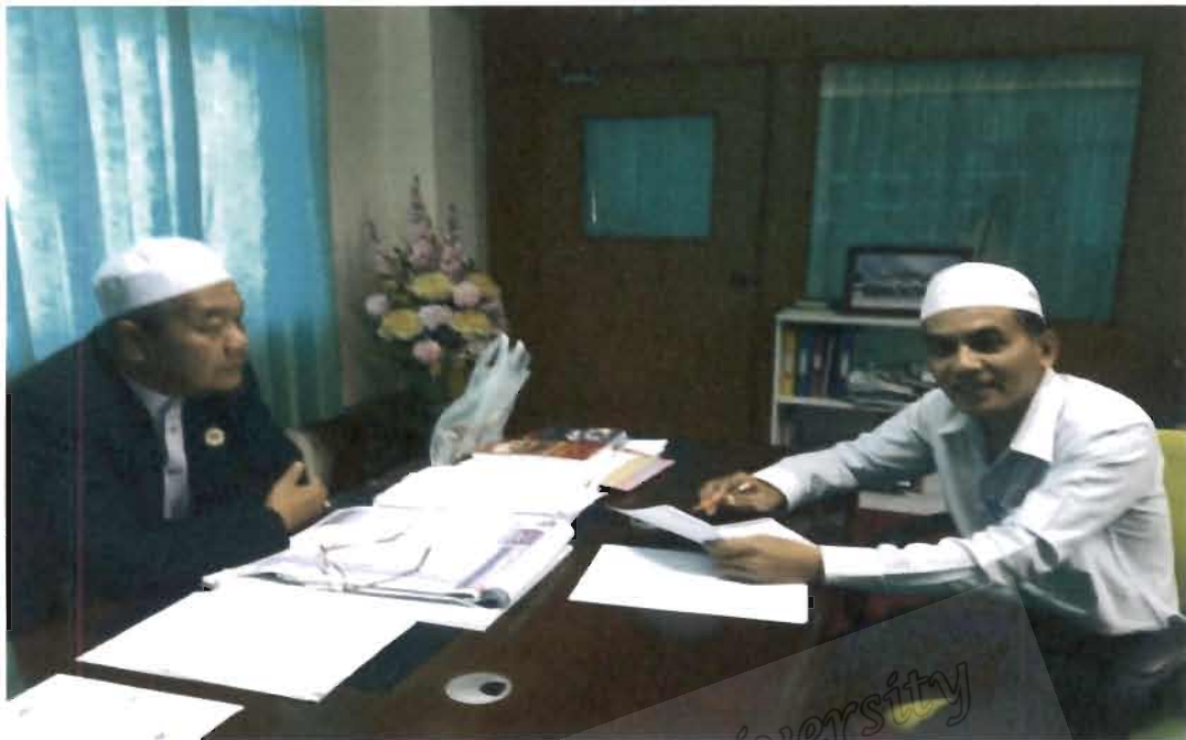
ภาพที่ 3 ประธานคณะกรรมการอิสลามประจำจังหวัดนครราชสีมา