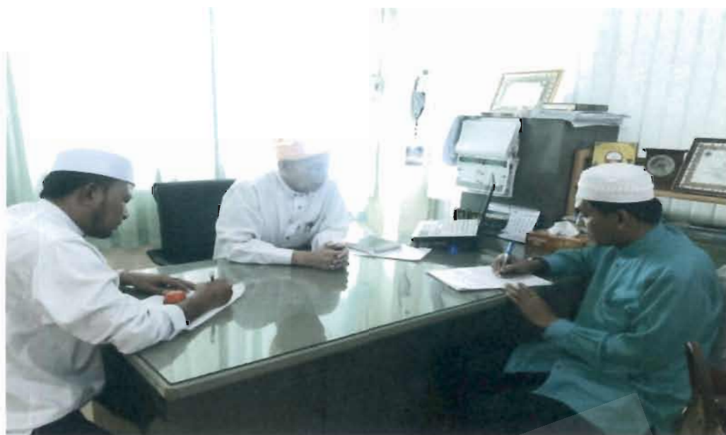
ภาพที่ 1 ประธานคณะกรรมการอิสลามประจำจังหวัดยะลา