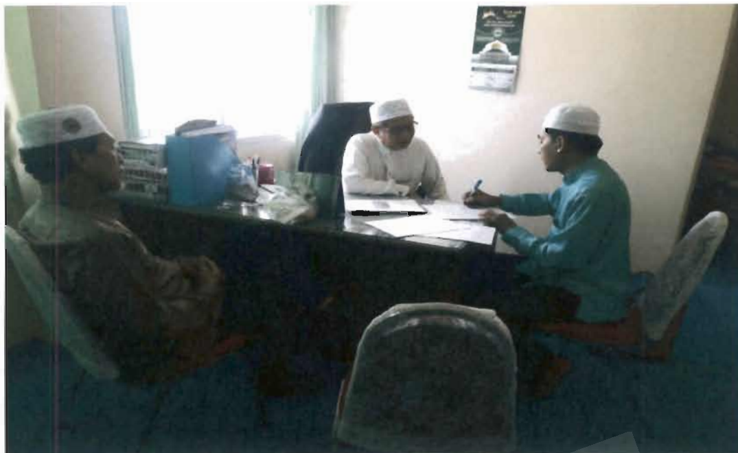
ภาพที่ 9 รองประธานคณะกรรมการอิสลามประจำจังหวัดยะลา