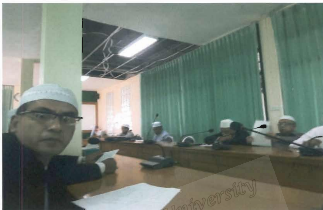
ภาพที่ 25 สำนักงานคณะกรรมการอิสลามประจำจังหวัดปัตตานี

Prince of Songkhro University Pattani Campus