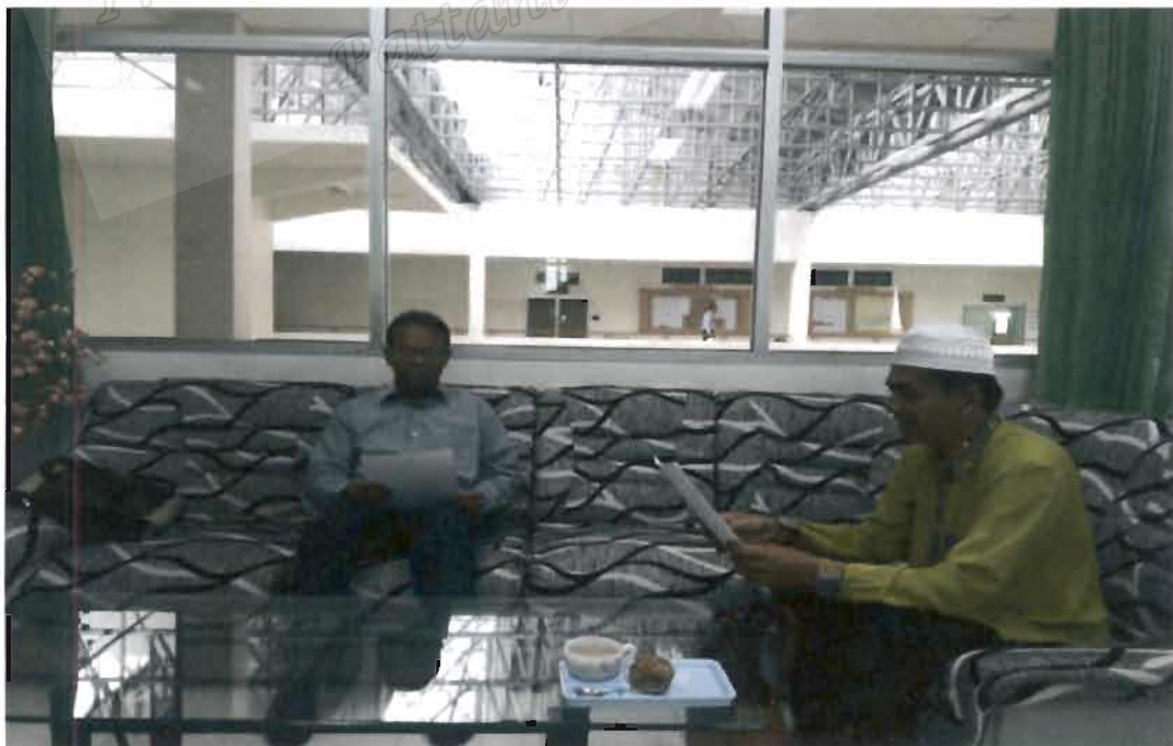
ภาพที่ 4 ผู้อำนวยการสถาบันอิสลามและอาหรับศึกษา มหาวิทยาลัยนครราชสีมาชนครินทร์