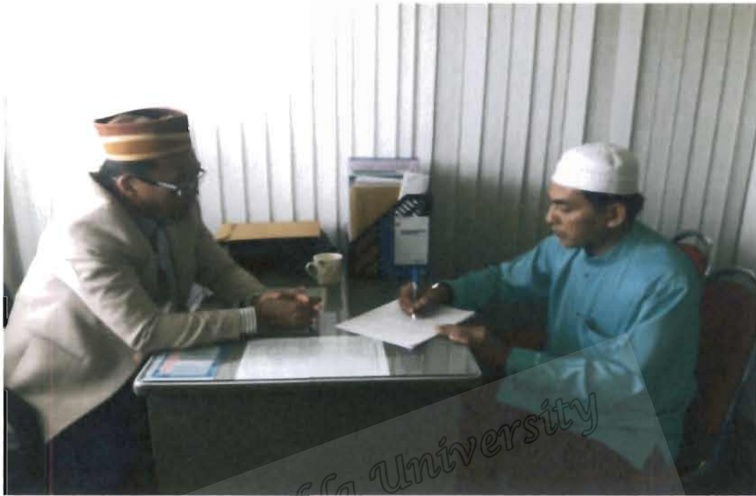
ภาพที่ 7 ประธานชมรมอิหม่ามจังหวัดยะลา