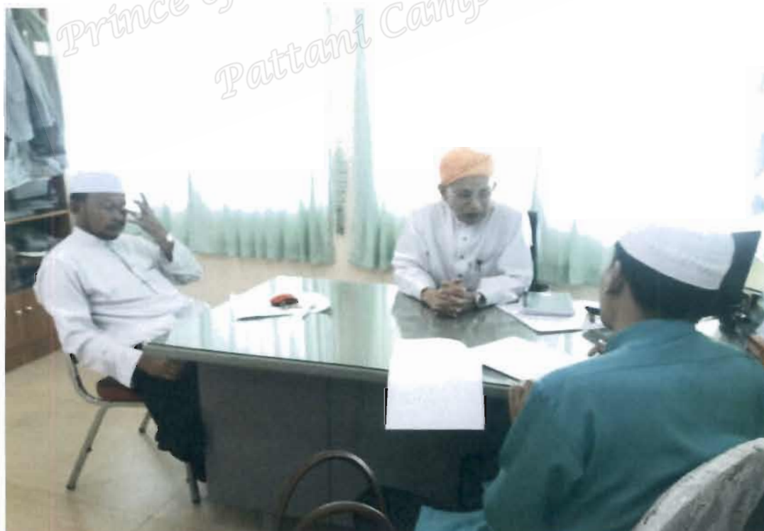
ภาพที่ 20 รองเลขานุการคณะกรรมการอิสลามประจำจังหวัดยะลา