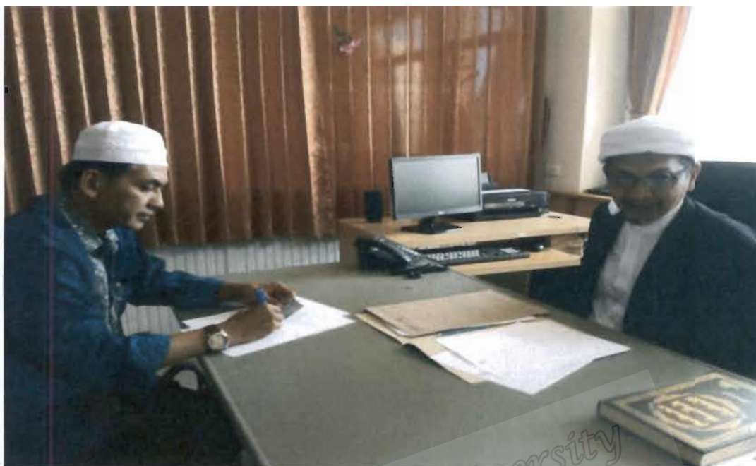
ภาพที่ 11 รองประธานคณะกรรมการอิสลามประจำจังหวัดปัตตานี