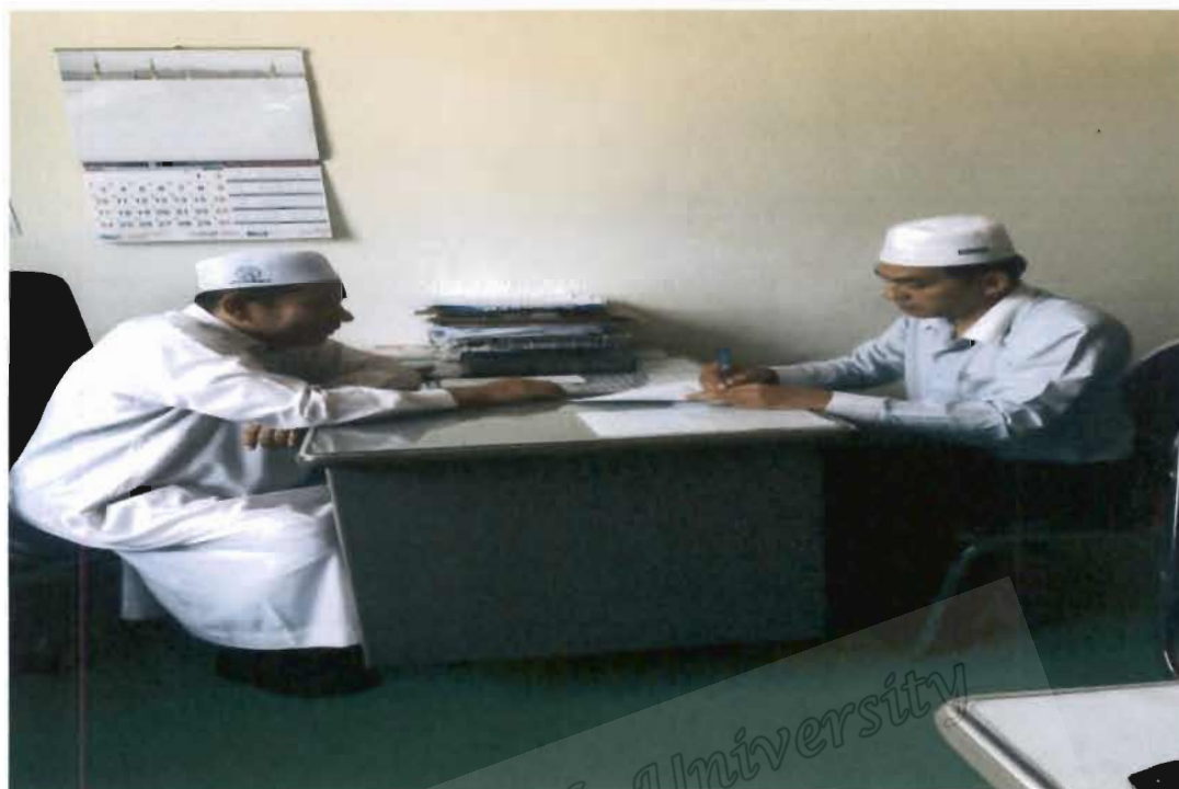
ภาพที่ 19 ประธานชมรมอิหม่ามจังหวัดนราธิวาส