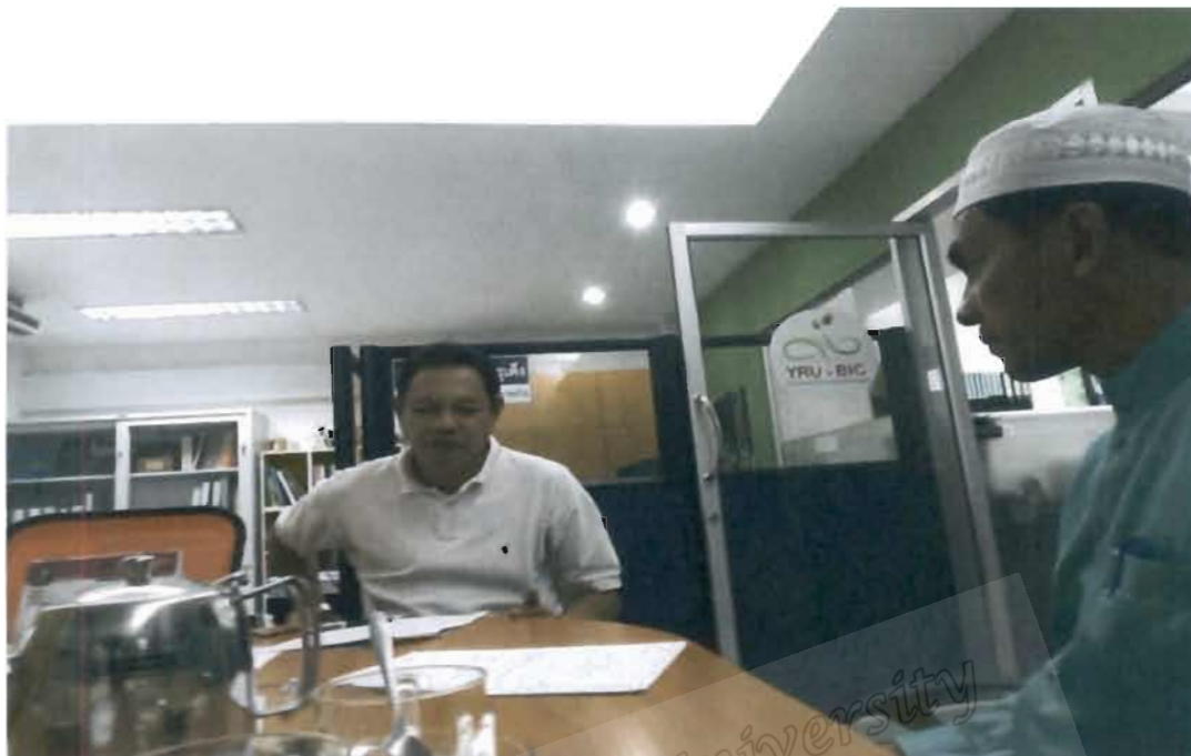
ภาพที่ 5 อาจารย์ประจำคณะวิทยาการจัดการ มหาวิทยาลัยราชภัฏยะลา