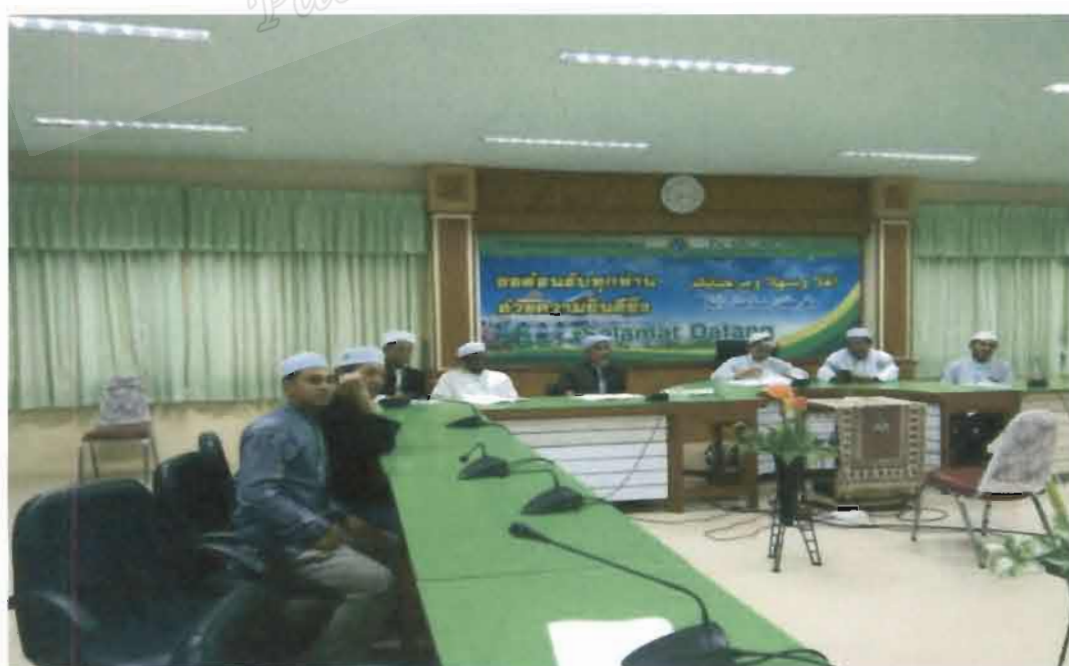
ภาพที่ 24 สำนักงานคณะกรรมการอิสลามประจำจังหวัดยะลา