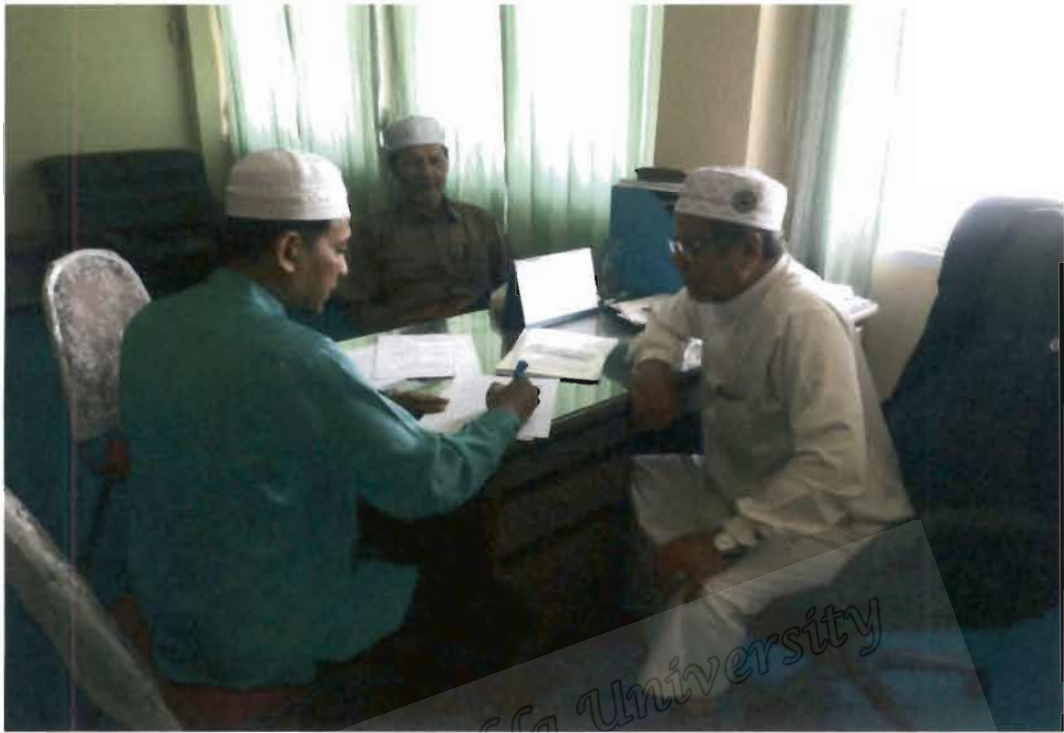
ภาพที่ 21 รองประธานคณะกรรมการอิสลามประจำจังหวัดยะลา