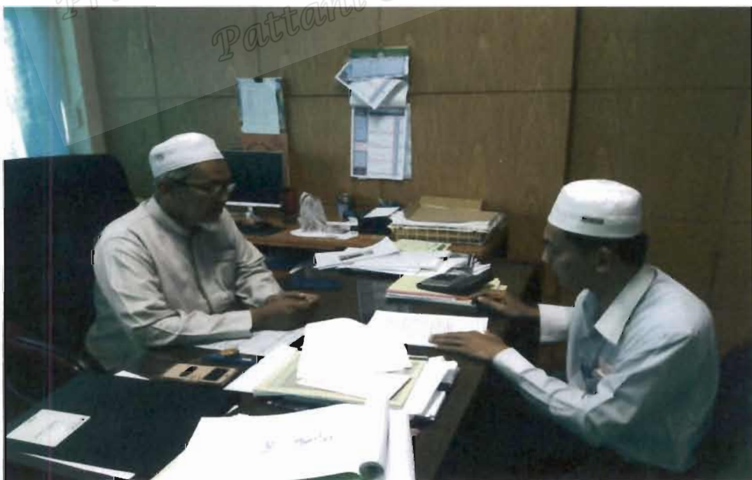
ภาพที่ 16 เลขานุการคณะกรรมการอิสลามประจำจังหวัดนราธิวาส