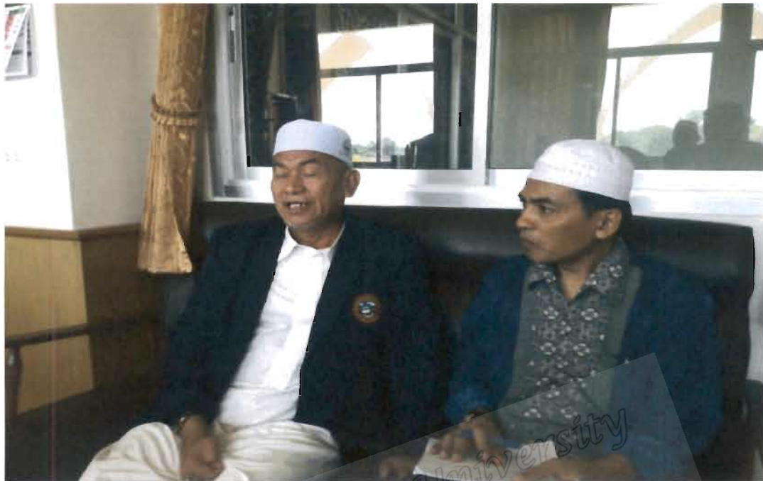
ภาพที่ 13 รองประธานคณะกรรมการอิสลามประจำจังหวัดปัตตานี