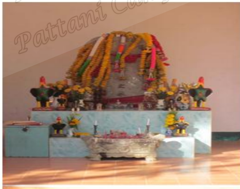
ภาพประกอบที่ ๘๕ ป้ายหินหน้าหลุมศพตาขุนลก หมู่ที่ ๔ ตำบลมะม่วงสองต้น จังหวัดนครศรีธรรมราช