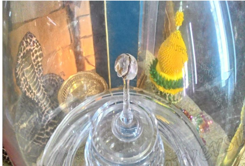
ภาพประกอบที่ ๖๗ ดวงแก้วที่ชาวบ้านเชื่อว่าพญางูคายไว้ให้สมเด็จพระเจ้าพะโคะ ปัจจุบันเก็บรักษา อยู่ที่วัดราชประดิษฐฐานหรือ วัดพะโคะ หมู่ที่ ๖ ตำบลชุมพล อำเภอสังขละ จังหวัดสงขลา