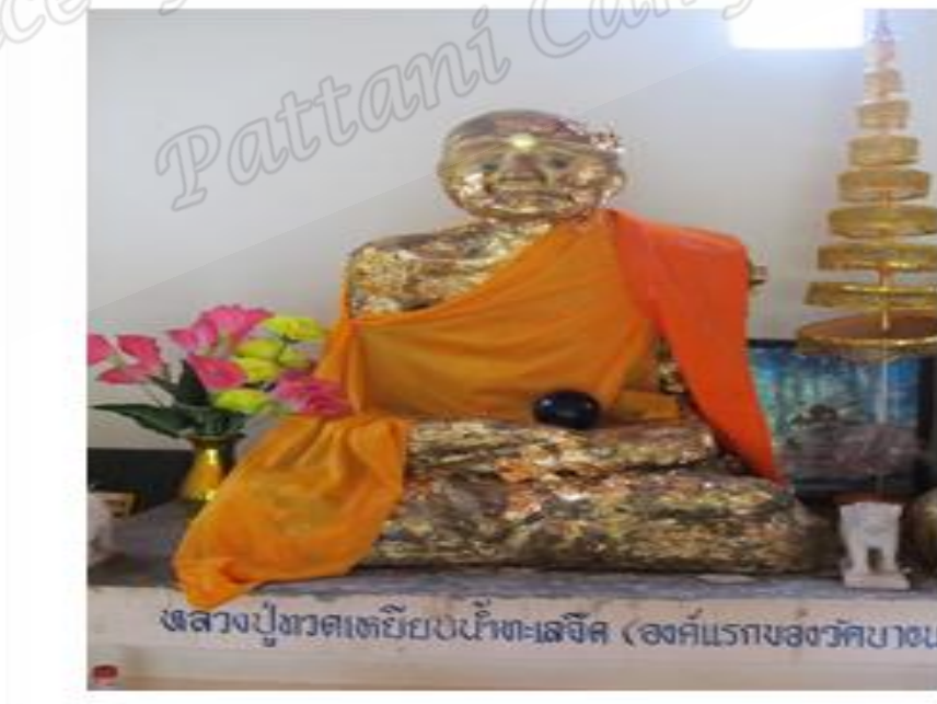
ภาพประกอบที่ ๙๘ รูปปั้นหลวงพ่อทวด วัดวาริบรรพตหรือวัดบางนอน หมู่ที่ ๑ ตำบลบางนอน อำเภอเมือง จังหวัดระนอง