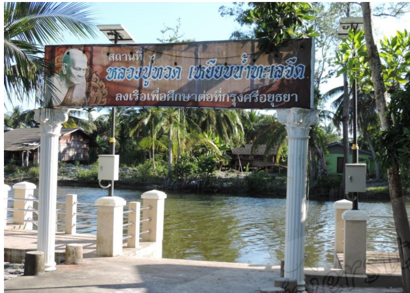
ภาพประกอบที่ ๔๐ สถานที่ลงเรือสำเภาของหลวงพ่อทวด วัดคงคาเลียบ หมู่ที่ ๓ ตำบลท่าซึก อำเภอเมือง จังหวัดนครศรีธรรมราช