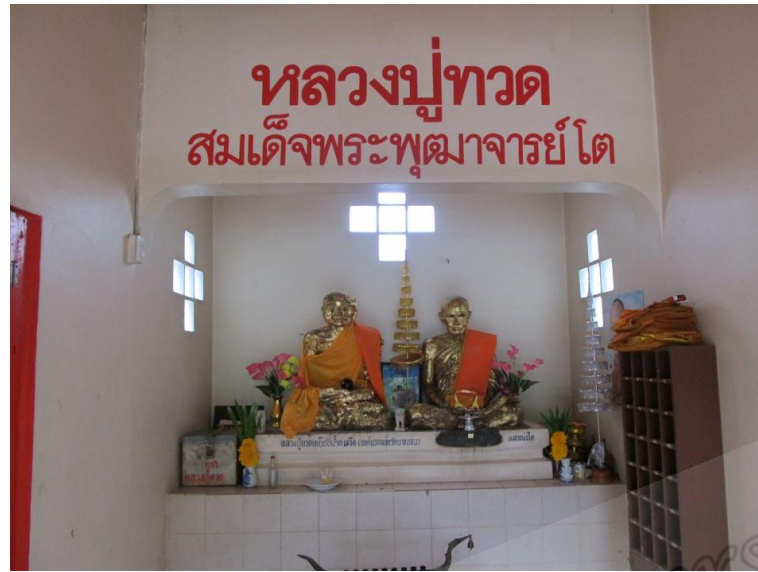
ภาพประกอบที่ ๙๗ รูปปั้นหลวงพ่อทวดเหยียบน้ำทะเลจืดและสมเด็จพระพุฒาจารย์ (โต พรหมรังสี) วัดวาริบรรพตหรือวัดบางนอน หมู่ที่ ๑ ตำบลบางนอน อำเภอเมือง จังหวัดระนอง