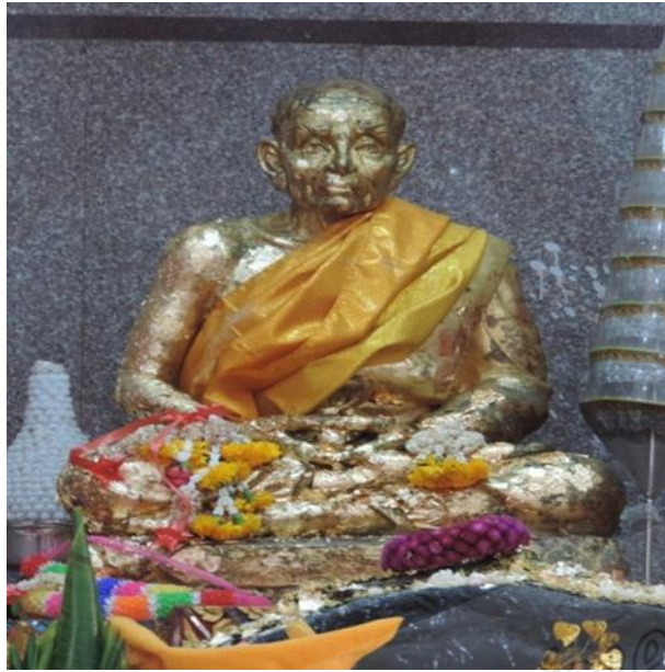
ภาพประกอบที่ ๖๓ หลวงพ่อทวดหล่อด้วยโลหะภายในวิหาร วัดราชประดิษฐฐาน (วัดพะโคะ) หมู่ที่ ๖ ตำบลชุมพล อำเภอสังขละบุรี จังหวัดสงขลา