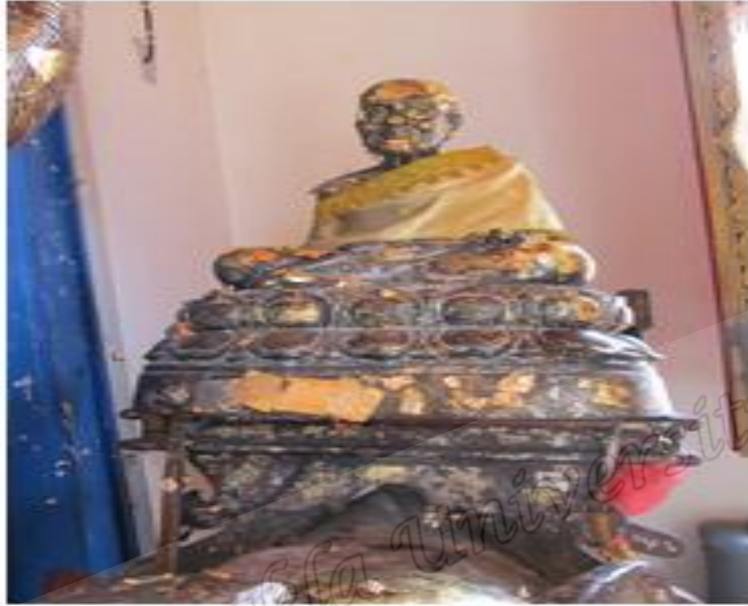
ภาพประกอบที่ ๗๘ รูปหล่อหลวงพ่อดนั้งบนหลังช้างภายในวิหารวัดราษฎร์บูรณะ (วัดช้างให้) หมู่ที่ ๒ ตำบลควนโนรี อำเภอดอกพญาตี จังหวัดปัตตานี