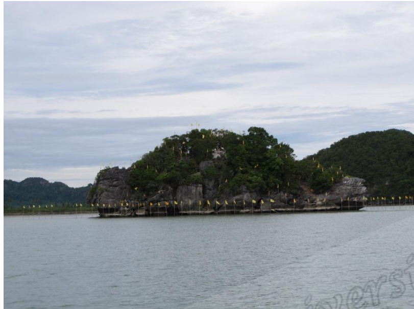
ภาพประกอบที่ ๙๕ เกาะนุ้ยนอก หมู่ที่ ๖ ตำบลท้องเนียน อำเภอขนอม จังหวัดนครศรีธรรมราช