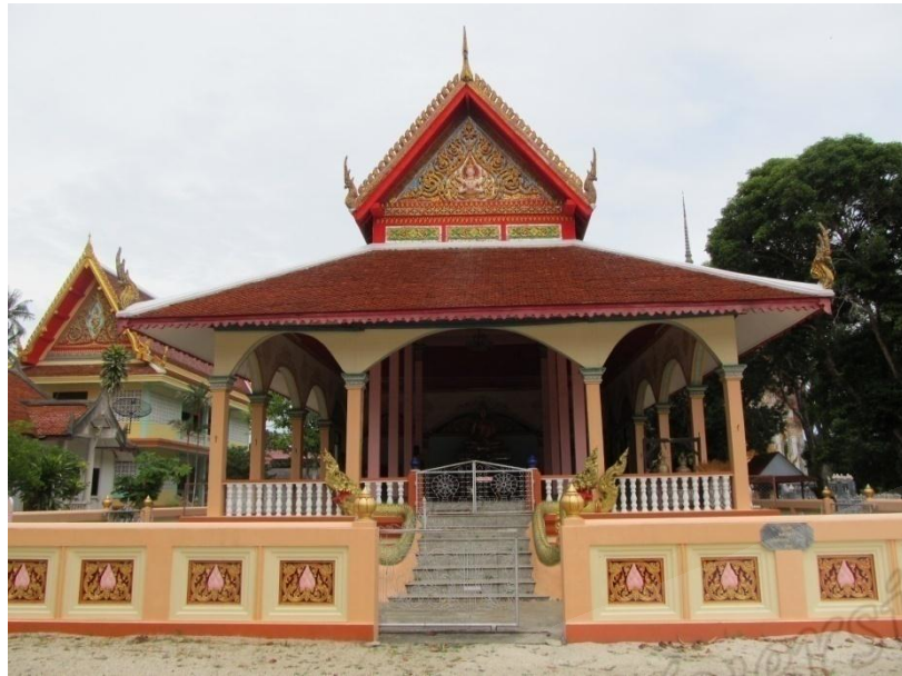
ภาพประกอบที่ ๘๒ อุโบสถวัดทรายขาว หมู่ที่ ๓ ตำบลทรายขาว อำเภอโคกโพธิ์ จังหวัดปัตตานี