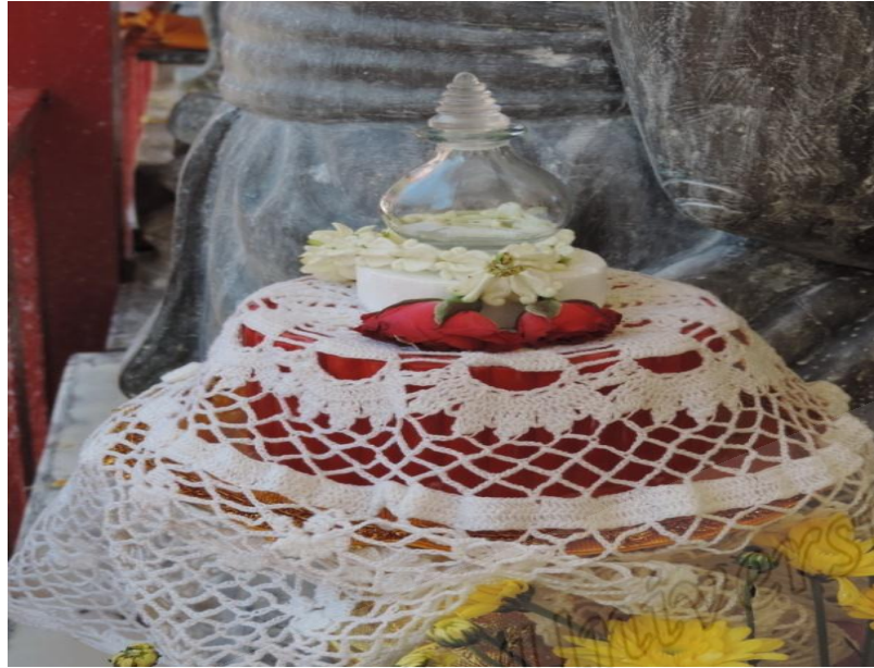
ภาพประกอบที่ ๗๔ น้ำสรงพระราชทานจากพระบาทสมเด็จพระเจ้าอยู่หัวในพิธีสรงน้ำหลวงพ่อทวดและอดีตเจ้าอาวาสวัดราชภูรบุรณะ (วัดช้างให้) หมู่ที่ ๒ ตำบลควนโนรี อำเภอกอโก้งโก้อี จังหวัดปัตตานี เมื่อวันที่ ๔ เมษายน พ.ศ. ๒๕๕๘