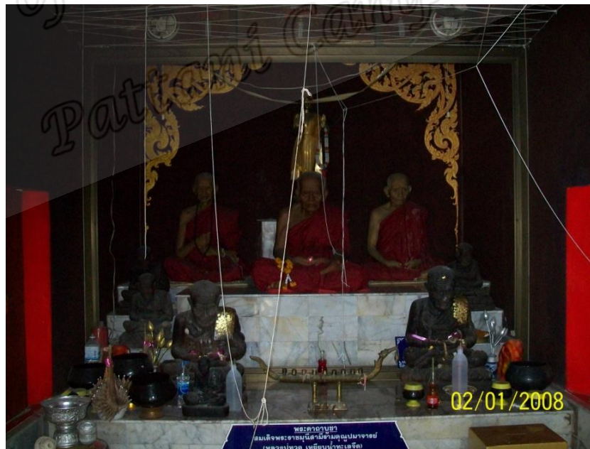
ภาพประกอบที่ ๔๑ หลวงพ่อทวดภายในวิหาร วัดคงคาเลียบ หมู่ที่ ๓ ตำบลท่าซึก อำเภอเมือง จังหวัดนครศรีธรรมราช