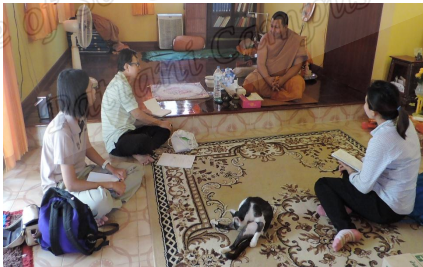
ภาพประกอบที่ ๘๙ ภาพการเก็บข้อมูลวัดท่าแพ หมู่ที่ ๑ ตำบลปากพูน อำเภอเมือง จังหวัดนครศรีธรรมราช