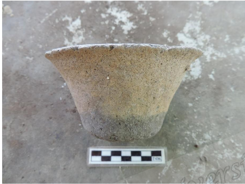
ภาพประกอบที่ ๙๔ เครื่องปั้นดินเผาสมัยก่อนประวัติศาสตร์ขุดพบที่เนินดินสถานที่ปักกลด สมเด็จพระเจ้าพะโคะ บ้านหน้าโกฏิ หมู่ที่ ๑๐ ตำบลขนานนาก อำเภอปากพนัง จังหวัดนครศรีธรรมราช

Prince of Songkhro University Pattani Campus