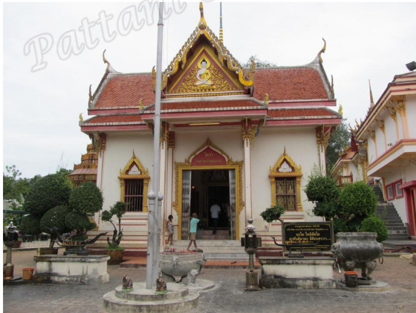
ภาพประกอบที่ ๗๙ วิหารหลวงพ่อดนั้งวัดราษฎร์บูรณะ (วัดช้างให้) หมู่ที่ ๒ ตำบลควนโนรี อำเภอดอกพญาตี จังหวัดปัตตานี