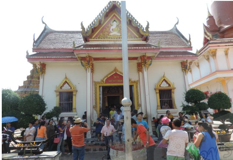
ภาพประกอบที่ ๗๒ วิหารหลวงพ่อทวดวัดช้างไห้ในพิธีสงฆ์น้ำหลวงพ่อทวดวัดราชภรณ์บูรณะ (วัดช้างไห้) หมู่ที่ ๒ ตำบลควนโนรี อำเภอกะป้อ จังหวัดปัตตานี เมื่อวันที่ ๔ เมษายน พ.ศ. ๒๕๕๘