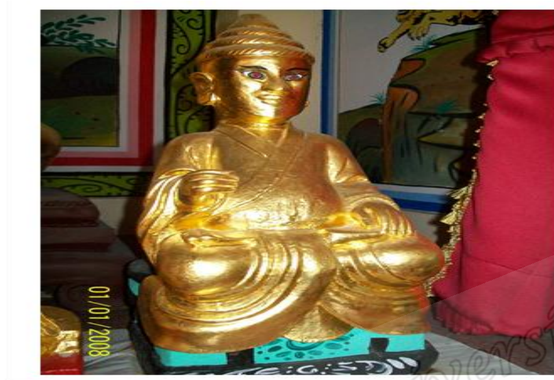
ภาพประกอบที่ ๘๖ รูปจำลองตาขุนลก ภายในศาลพระเสื้อเมือง อำเภอเมือง จังหวัดนครศรีธรรมราช