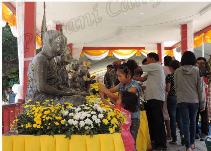
ภาพประกอบที่ ๗๓ พิธีสงฆ์น้ำหลวงพ่อทวดและอดีตเจ้าอาวาสวัดราชภรณ์บูรณะ (วัดช้างไห้) หมู่ที่ ๒ ตำบลควนโนรี อำเภอกะป้อ จังหวัดปัตตานี เมื่อวันที่ ๔ เมษายน พ.ศ. ๒๕๕๘