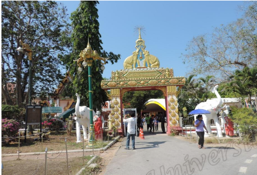
ภาพประกอบที่ ๗๐ ชุ้มประต้วัดราชบุรณะ (วัดช้างไห้) ตำบลควนโนรี อำเภอกอฉกโพธิ์ จังหวัดปัตตานี