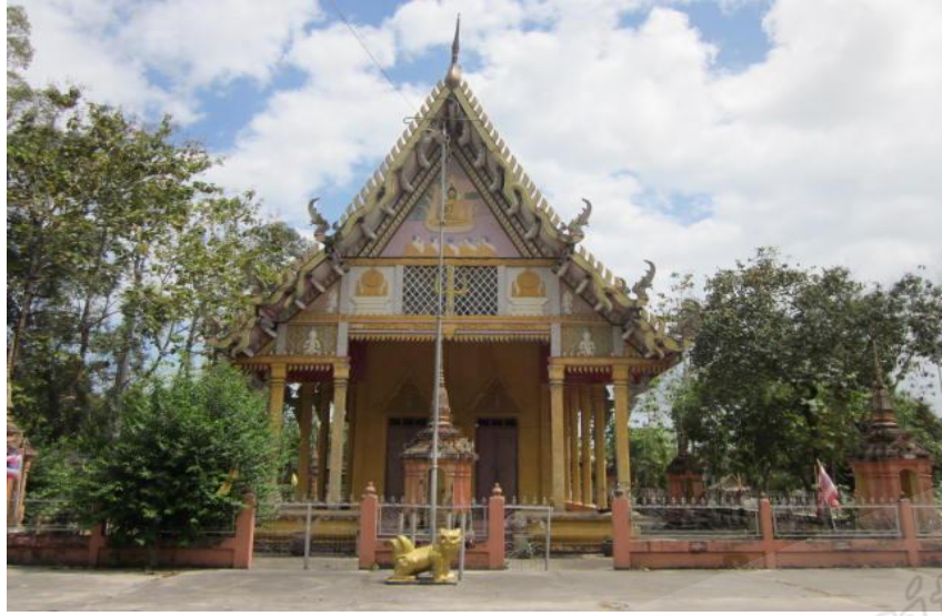
ภาพประกอบที่ ๘๘ อุโบสถวัดท่าแพ หมู่ที่ ๑ ตำบลปากพูน อำเภอเมือง จังหวัดนครศรีธรรมราช