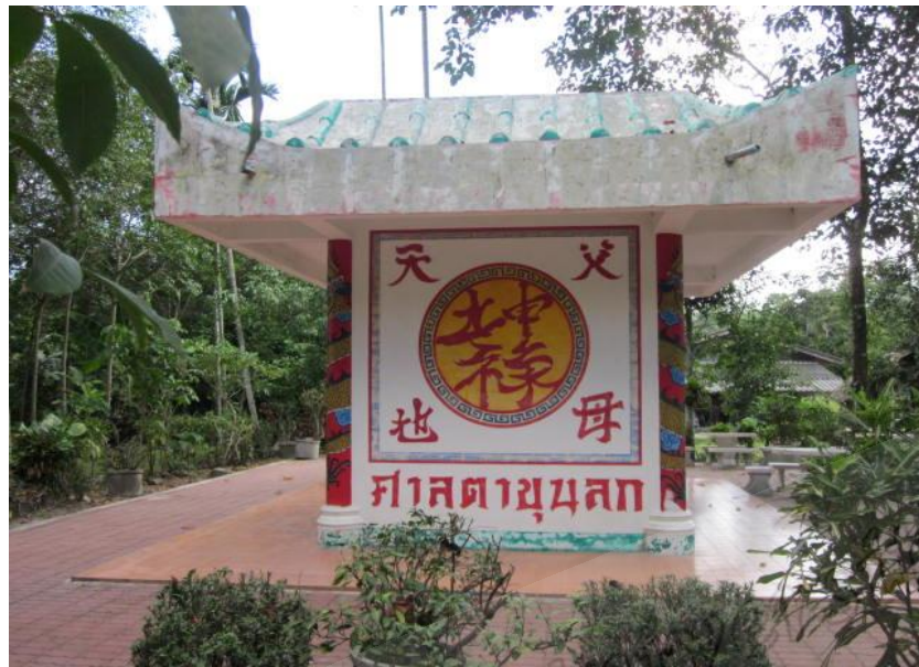
ภาพประกอบที่ ๘๔ สุสานตาขุนลก หมู่ที่ ๔ ตำบลมะม่วงสองต้น อำเภอเมือง จังหวัดนครศรีธรรมราช