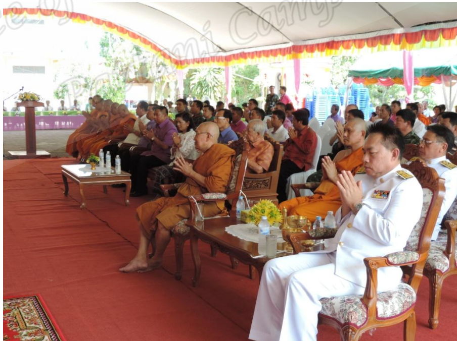
ภาพประกอบที่ ๗๑ การประกอบพิธีสงฆ์น้ำหลวงพ่ทวดวัดราชบุรณะ (วัดช้างไห้) หมู่ที่ ๒ ตำบลควนโนรี อำเภอกอฉกโพธิ์ จังหวัดปัตตานี เมื่อวันที่ ๔ เมษายน ๒๕๕๘