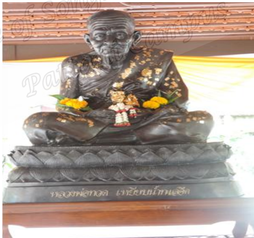
ภาพประกอบที่ ๘๓ รูปหล่อหลวงพ่อทวดวัดตานีนรสโมสร อำเภอเมือง จังหวัดปัตตานี