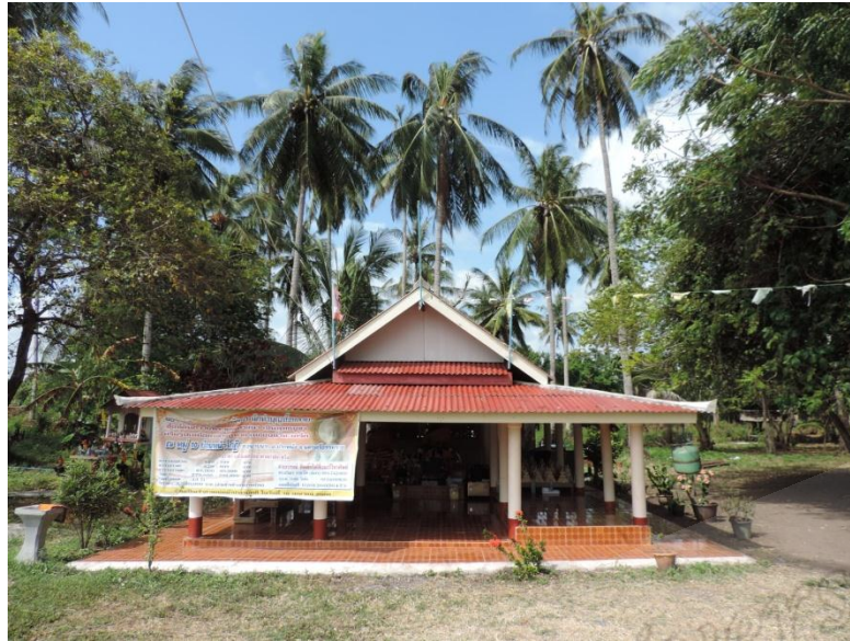
ภาพประกอบที่ ๙๒ ศาลาหลวงพ่อทวดบ้านหน้าโกฏิ หมู่ที่ ๑๐ ตำบลขนานนาก อำเภอปากพนัง จังหวัดนครศรีธรรมราช