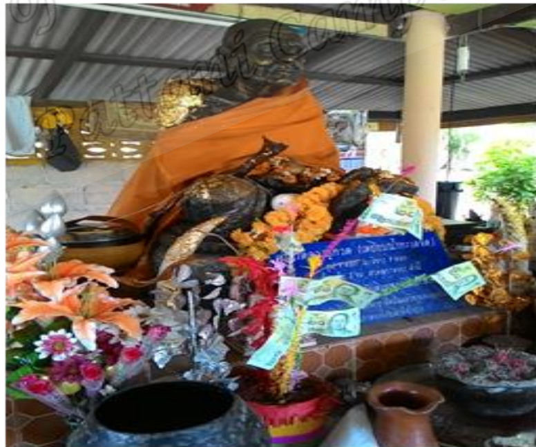
ภาพประกอบที่ ๙๓ สถานที่ปักกลดสมเด็จพระเจ้าพะโคะบ้านหน้าโกฏิ หมู่ที่ ๑๐ ตำบลขนานนาก อำเภอปากพนัง จังหวัดนครศรีธรรมราช