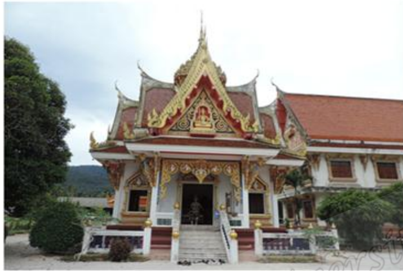
ภาพประกอบที่ ๘๐ วิหารสามทวด วัดทรายขาว หมู่ที่ ๓ ตำบลทรายขาว อำเภอโคกโพธิ์ จังหวัดปัตตานี