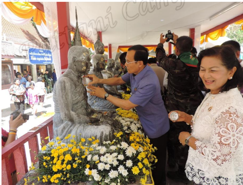
ภาพประกอบที่ ๗๕ พิธีสรงน้ำหลวงพ่อทวดและอดีตเจ้าอาวาสวัดราชภูรบุรณะ (วัดช้างให้) หมู่ที่ ๒ ตำบลควนโนรี อำเภอกอโก้งโก้อี จังหวัดปัตตานี เมื่อวันที่ ๔ เมษายน พ.ศ. ๒๕๕๘