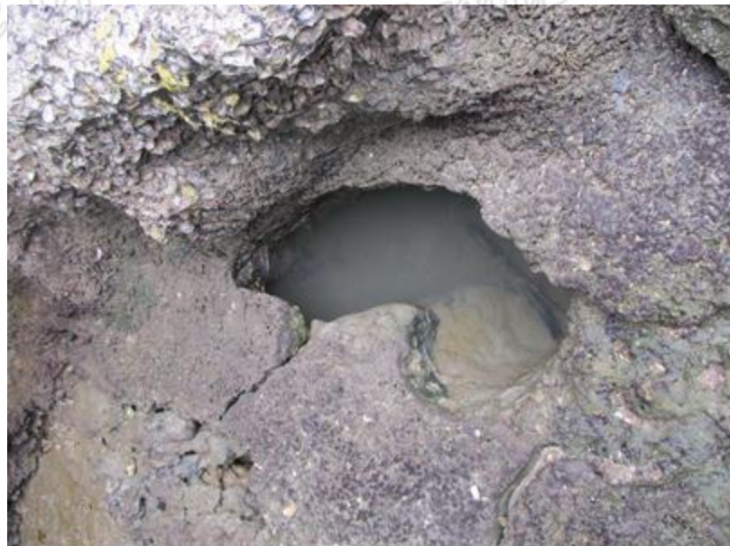
ภาพประกอบที่ ๙๖ บ่อน้ำรอยเท้าหลวงพ่อทวด เกาะนุ้ยนอก หมู่ที่ ๖ ตำบลท้องเนียน อำเภอขนอม จังหวัดนครศรีธรรมราช