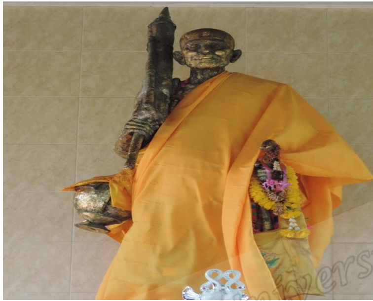
ภาพประกอบที่ ๖๕ รูปหล่อสมเด็จพระเจ้าพะโคะแบบชุดงศ์ ประดิษฐานไว้ที่วัดพะโคะ หมู่ที่ ๖ ตำบลชุมพล อำเภอสังขละบุรี จังหวัดสงขลา