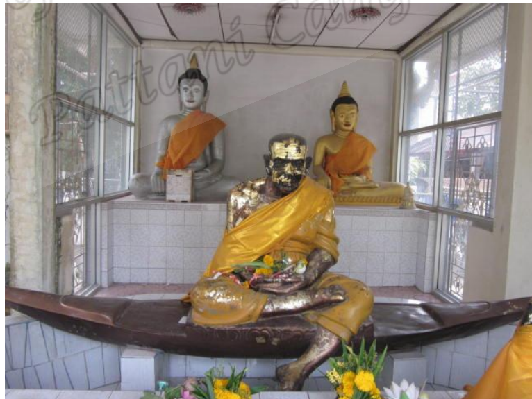
ภาพประกอบที่ ๘๗ รูปหล่อหลวงพ่อดาววัดเสมาเมือง ตำบลในเมือง อำเภอเมือง จังหวัดนครศรีธรรมราช