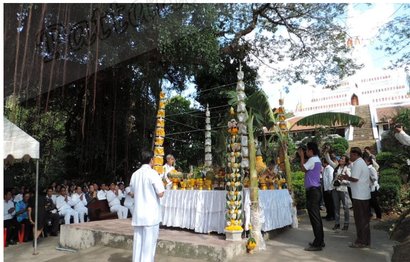
ภาพประกอบที่ ๖๘ พิธีบวงสรวงสมเด็จพระเจ้าพะโคะ วัดพะโคะ หมู่ที่ ๖ ตำบลชุมพล อำเภอสังขละ จังหวัดสงขลา เมื่อวันที่ ๔ มีนาคม พ.ศ. ๒๕๕๘