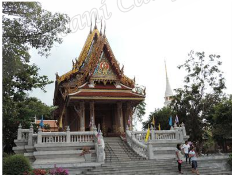
ภาพประกอบที่ ๖๖ อุโบสถวัดราชประดิษฐานหรือวัดพะโคะ ตั้งอยู่บนเขาพะโคะ หมู่ที่ ๖ ตำบลชุมพล อำเภอสังขละบุรี จังหวัดสงขลา เป็นวัดที่สร้างมาตั้งแต่สมัยอยุธยา