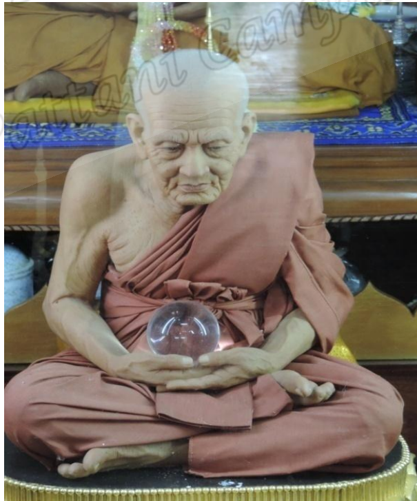
ภาพประกอบที่ ๖๔ รูปหลวงพ่อทวดภายในกุฏิเจ้าอาวาสวัดราชประดิษฐฐาน (วัดพะโคะ) หมู่ที่ ๖ ตำบลชุมพล อำเภอสังขละบุรี จังหวัดสงขลา