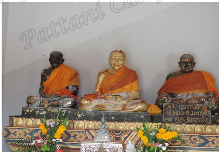
ภาพประกอบที่ ๘๑ รูปหล่อหลวงพ่อทวดสิทธิชัย หลวงพ่อทวดวัดช้างไห้และหลวงพ่อทวดหมาน ภายในวิหารสามทวด วัดทรายขาว หมู่ที่ ๓ ตำบลทรายขาว อำเภอโคกโพธิ์ จังหวัดปัตตานี